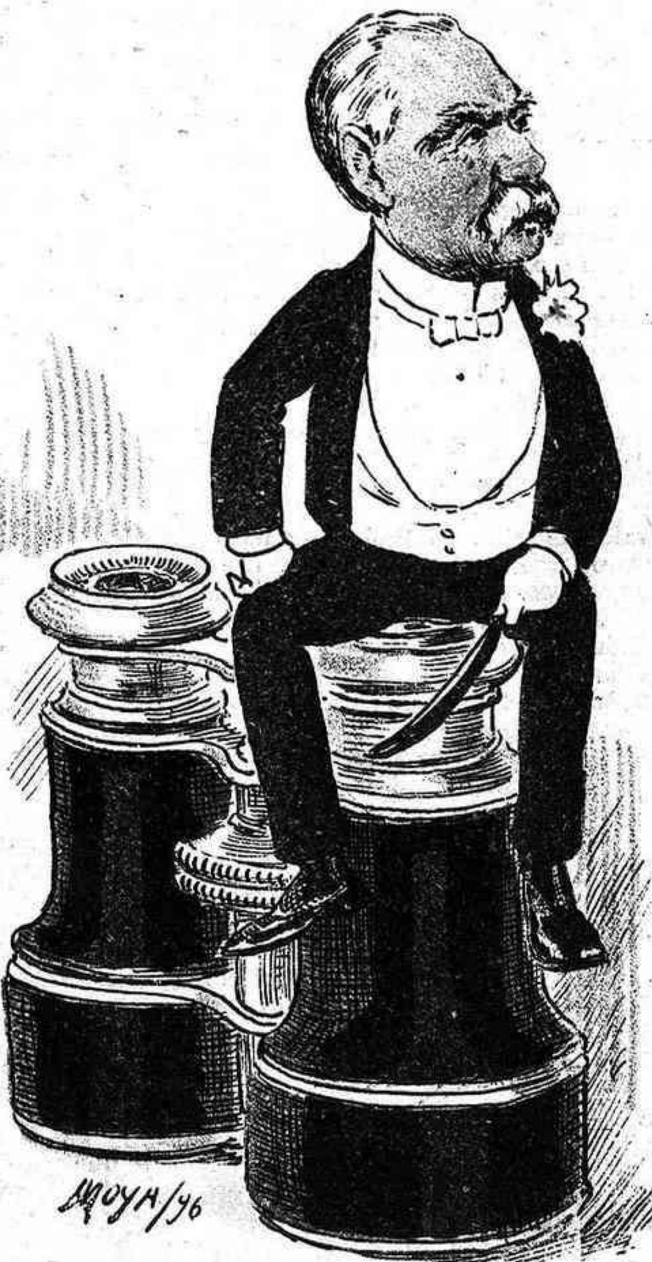
Puede ser, tal vez, acaso, quizás que aquí venga usted, marqués, para hacer el paso... el Paso de la Merced.