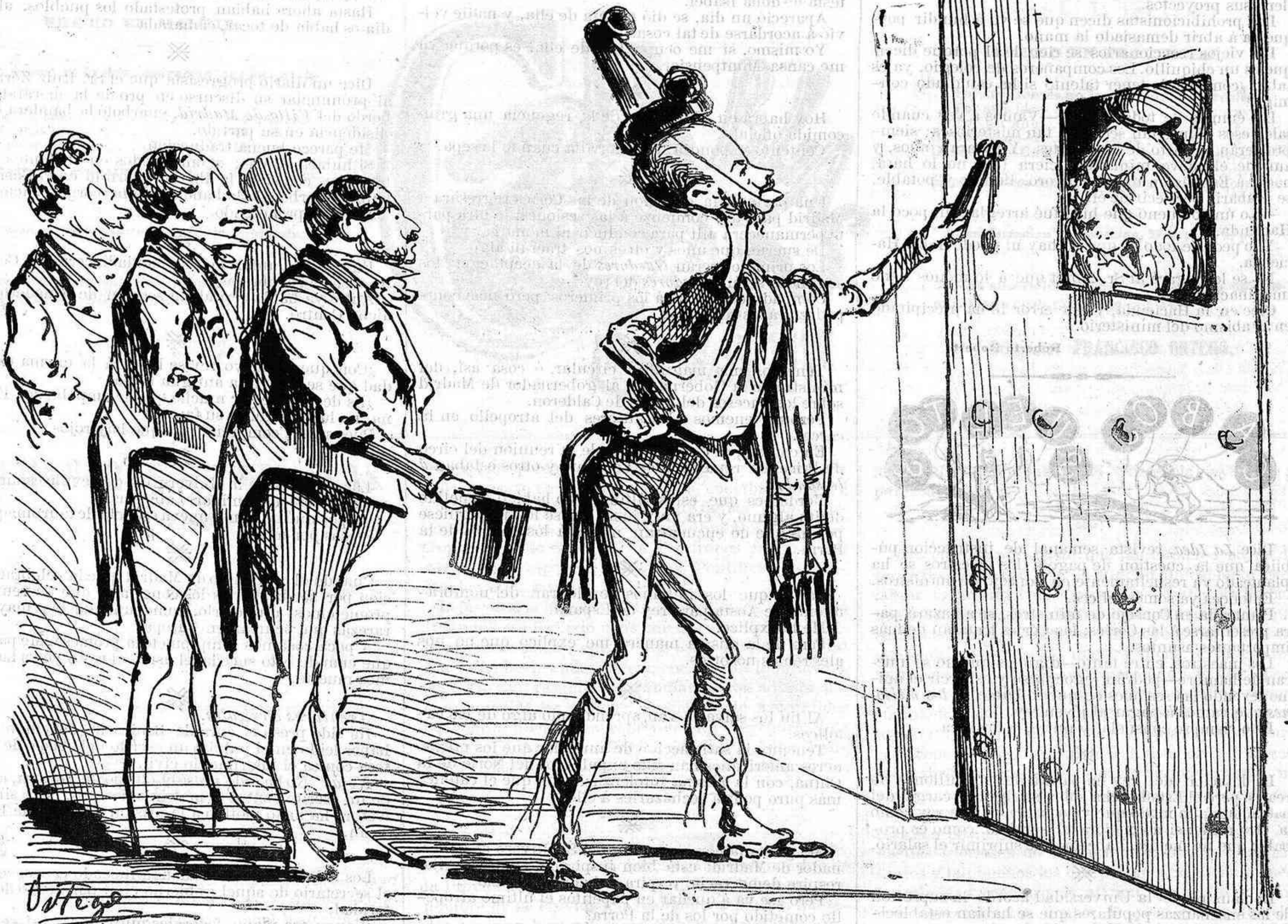
—¡Signorino, io sono il Re que vene hispagnolisado!