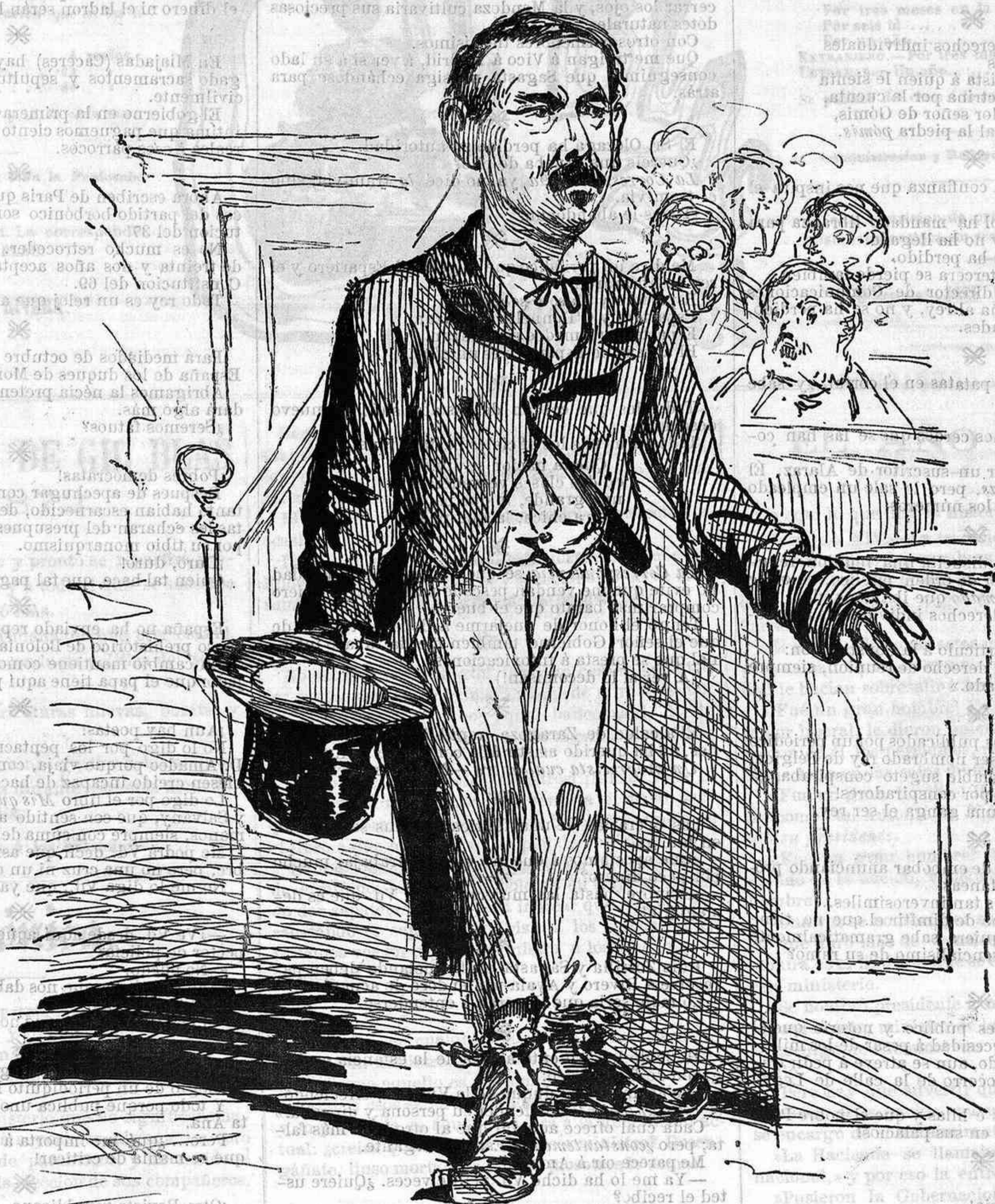
A consecuencia de las economías, el presidente del Consejo de ministros se presenta ante el país en un estado lamentable.

creerán Vds. que ceden sus conspiraciones, sus alzamientos, sus motines y sus proyectos anarquistas? Por nada, ó casi nada; por una ración de legalidad, por un trozo de justicia, por una compota de democracia... por ménos que un plato de lentejas.