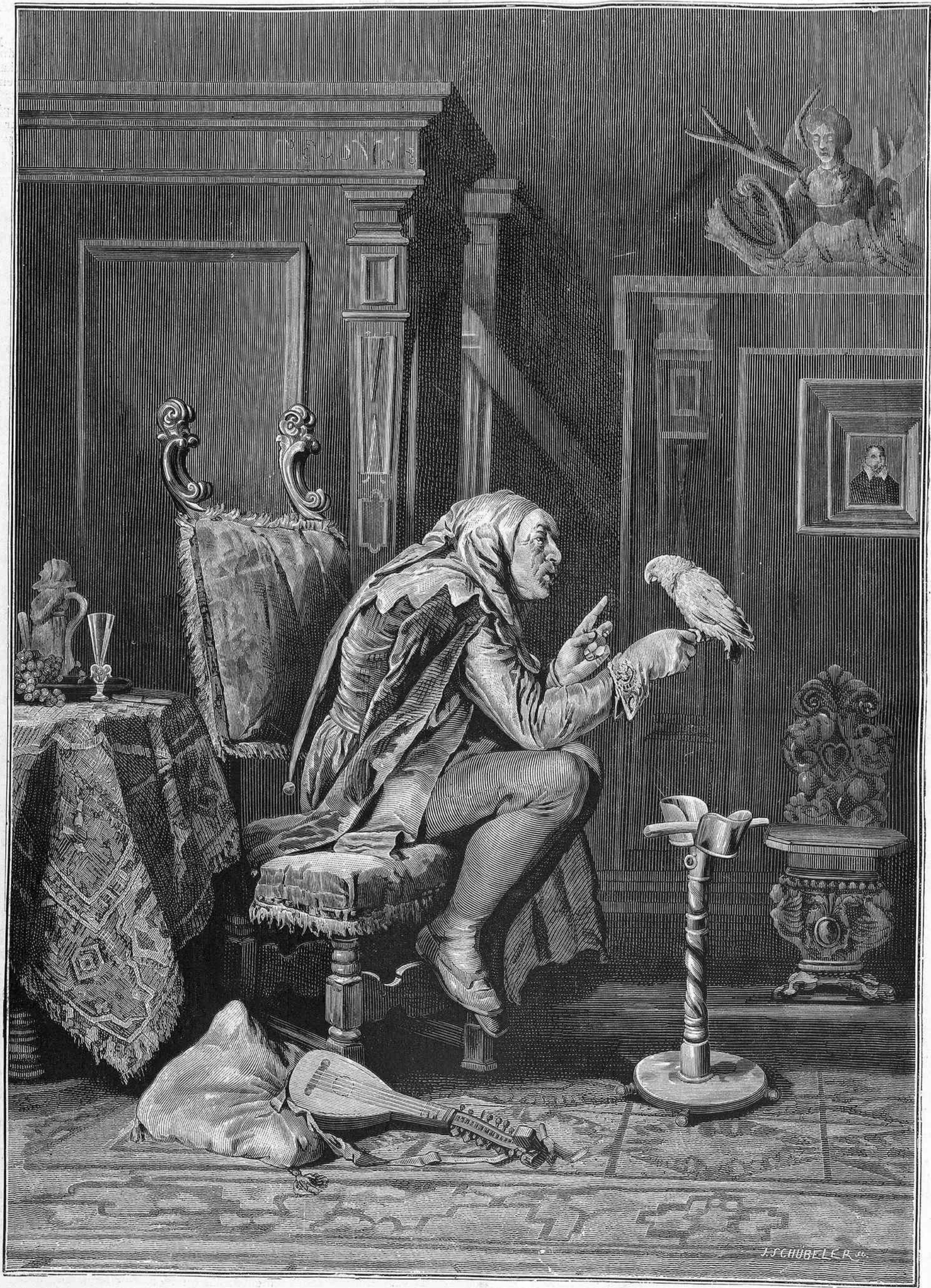
EL BUFON Y LA COTORRA