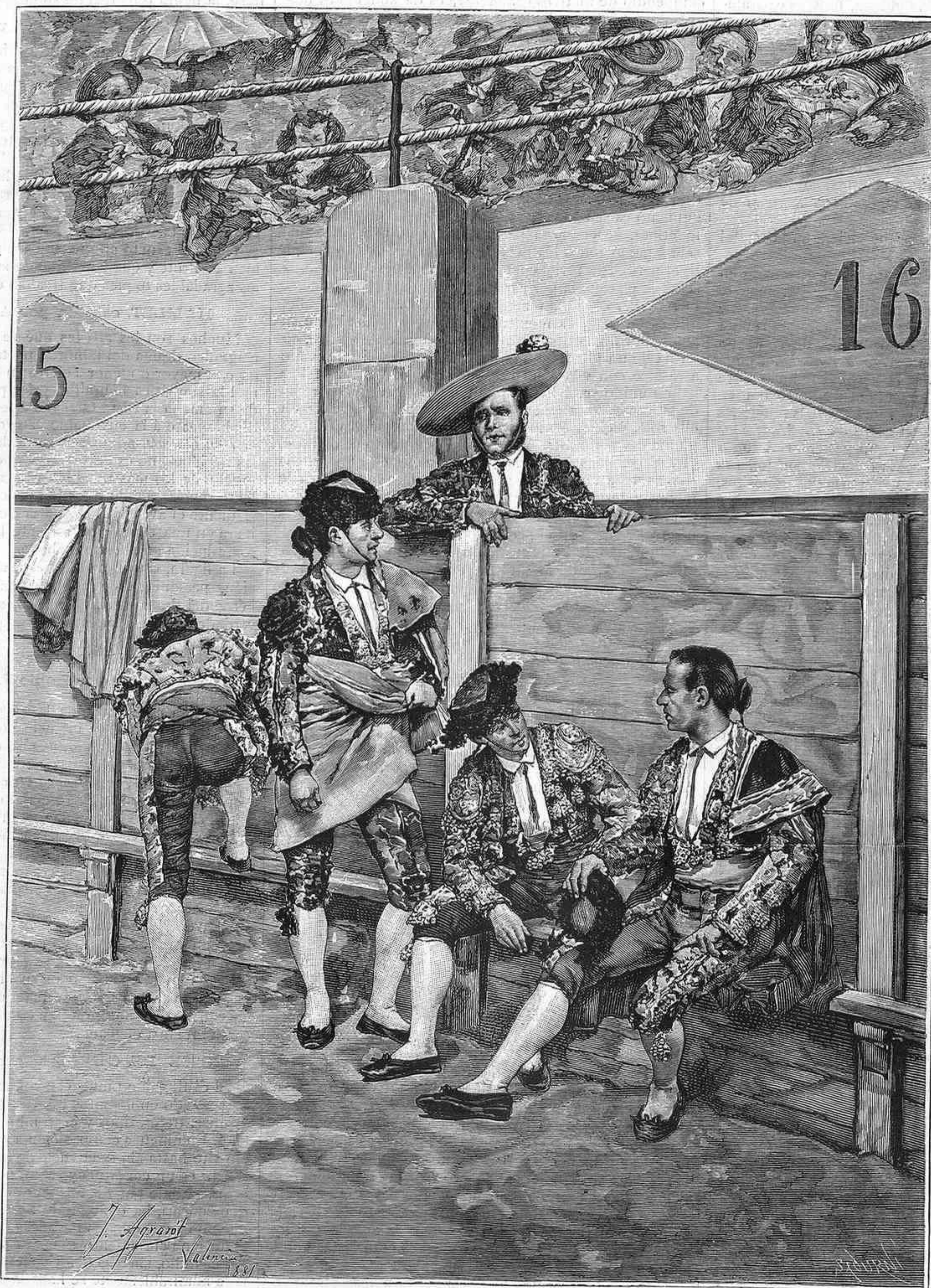
EN LA PLAZA, acuarela por J. Agrasot

REGALO A LOS SEÑORES SUSCRITORES DE LA BIBLIOTECA UNIVERSAL ILUSTRADA