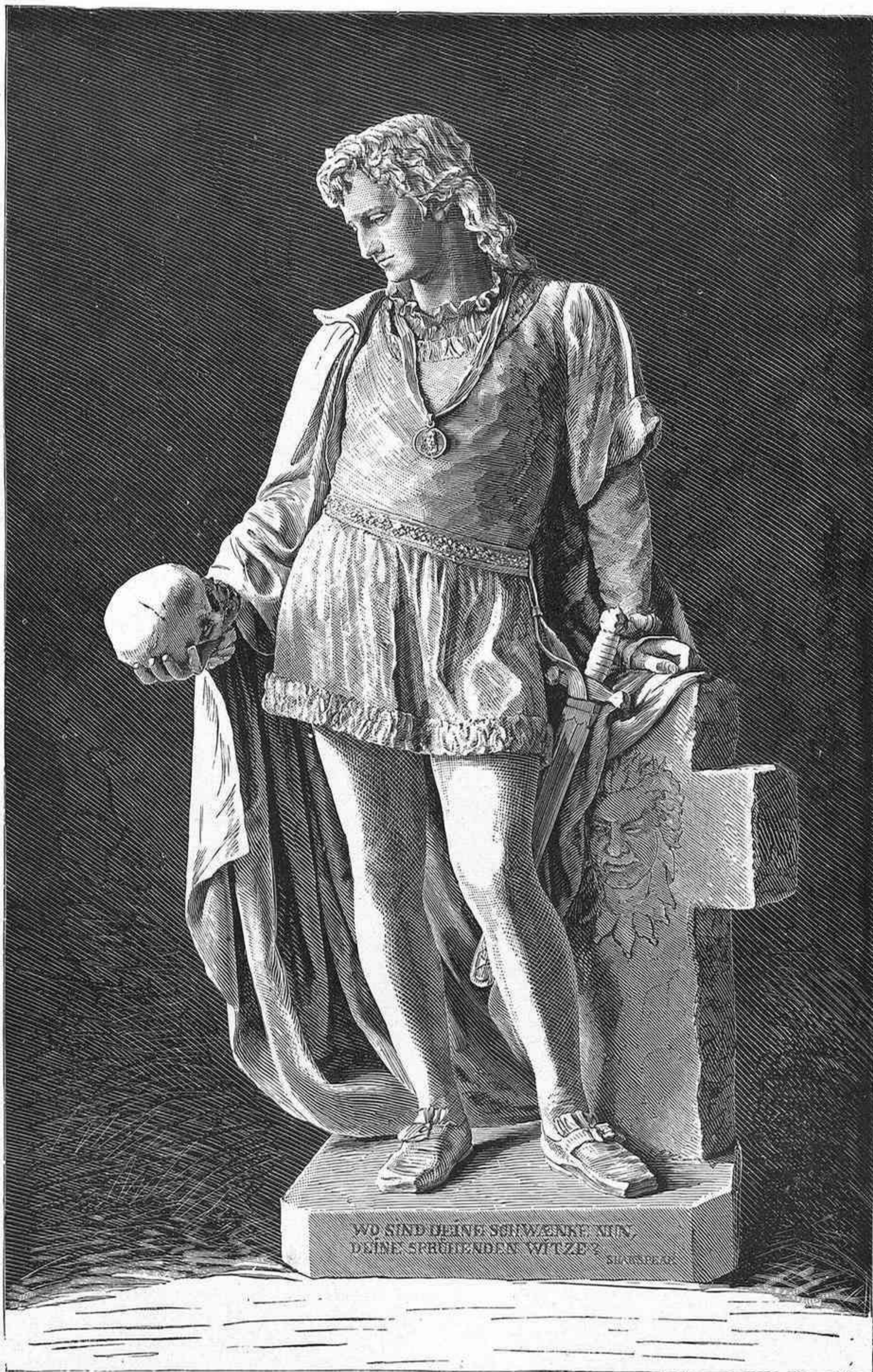
HAMLET estatua por A. Weizenberg

El color de sus aguas, hasta la costa de las Carolinas, es azul oscuro, y tan distinto del mar que atraviesa, que puede marcarse la línea divisoria á la simple vista; y sucede con frecuencia, cuando se navega en una de sus orillas, que medio buque está en la corriente del Gulf-Stream , y el otro medio en