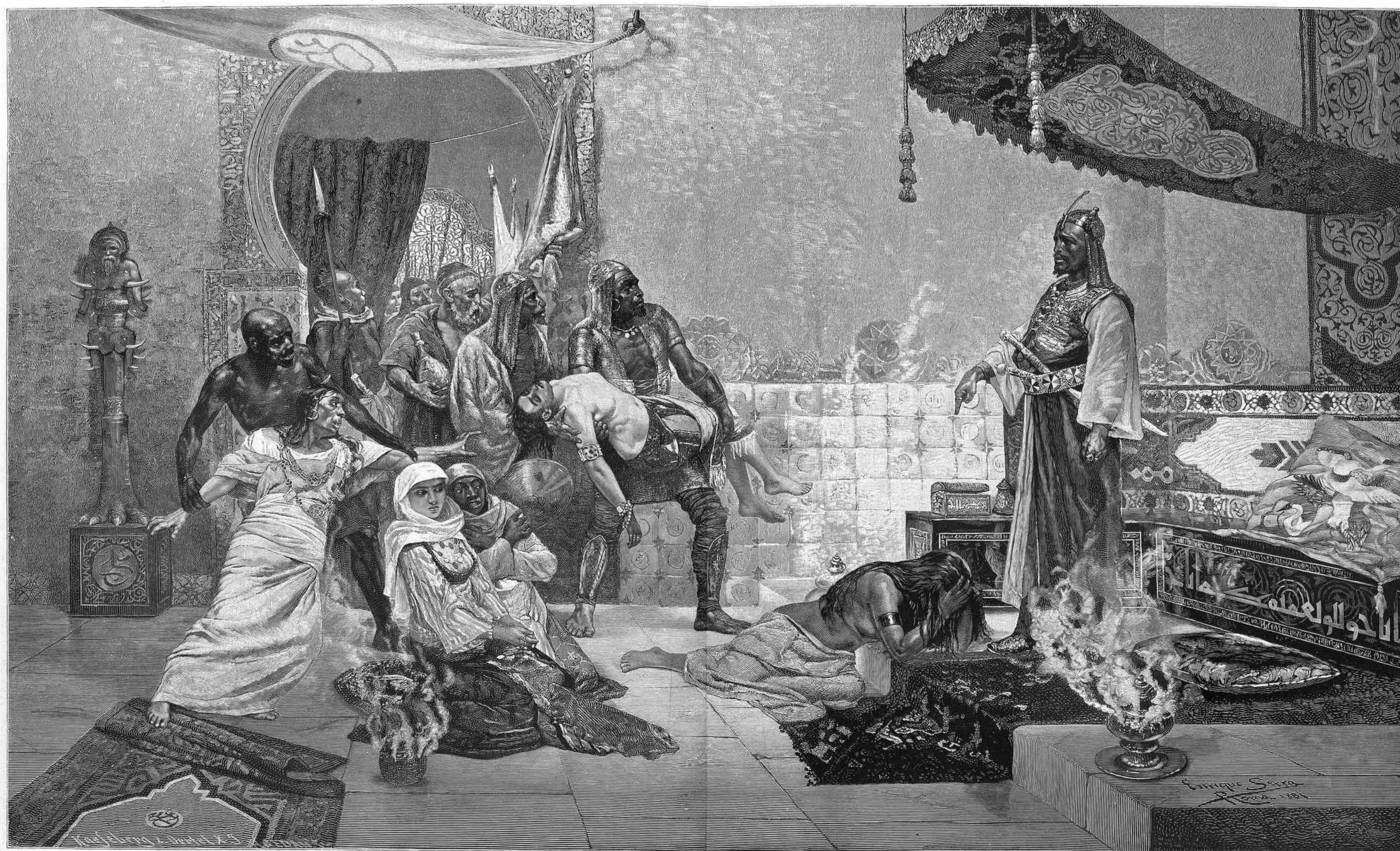
BOTIN DE GUERRA, COPIA DE UN CUADRO DE ENRIQUE SERRA