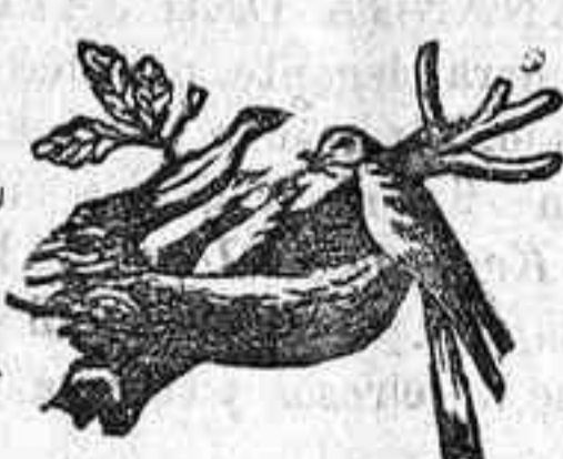
(Marca de garantía)

32 premios, de los cuales 12 Diplomas de honor y 14 Medallas de 1.ª. 20 años de éxito. Numerosos certificados de las primeras autoridades medicinales de ambos mundos.