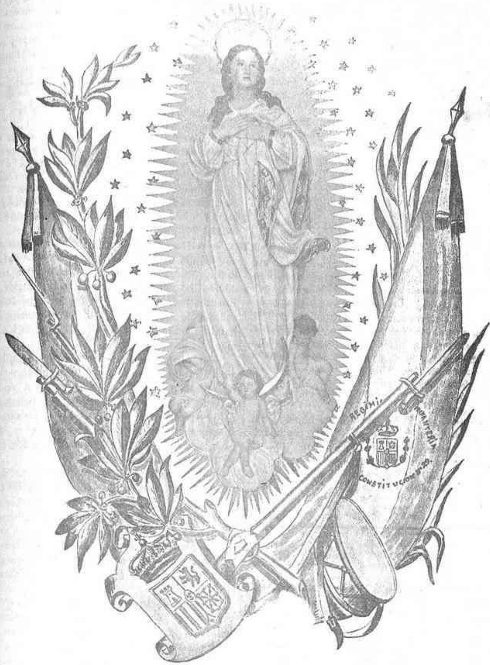
LA INMACULADA CONCEPCIÓN. PATRONA DE LA INFANTERÍA ESPAÑOLA