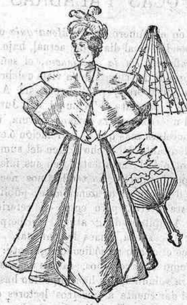
Traje para paseo.

De lana vicuña, corte sastrero; cuerpo ajustado, forma chaqueta, abrochado al lado izquierdo con cuatro gruesos botones de nacar, tres pespuntos alrededor de la sisa y dos alrededor de las aldetas; cuello alto; mangas de una pieza con pespuntos; falda lisa, forma campana.