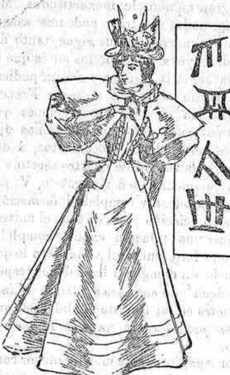
Otro traje para calle

De pañete, cuerpo liso forma inglesa; mangas de una pieza; esclavina corta del mismo género, con un cuello ancho y abrochado con un botón; falda muy acampanada con dos quillas en el delantero llevando pespuente.