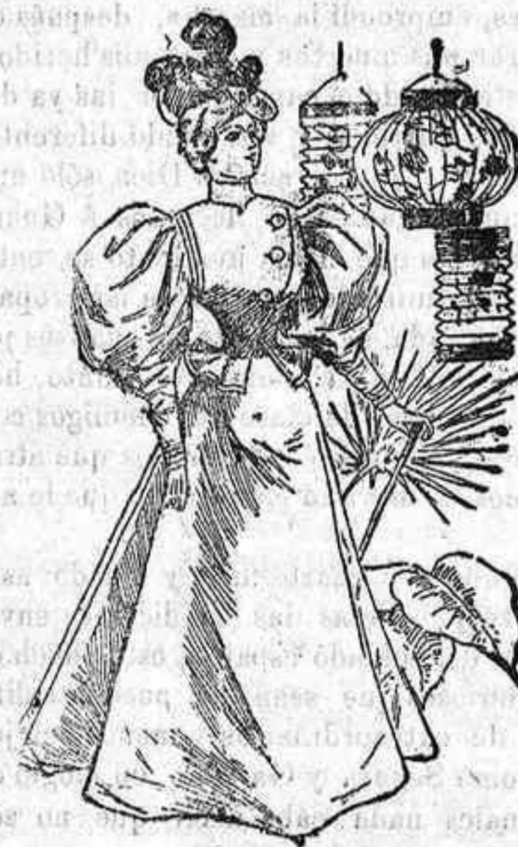
Traje para calle.

Modelos exclusivos para nuestras lectoras, de los grandes almacenes de «El Siglo», Barcelona. (1)