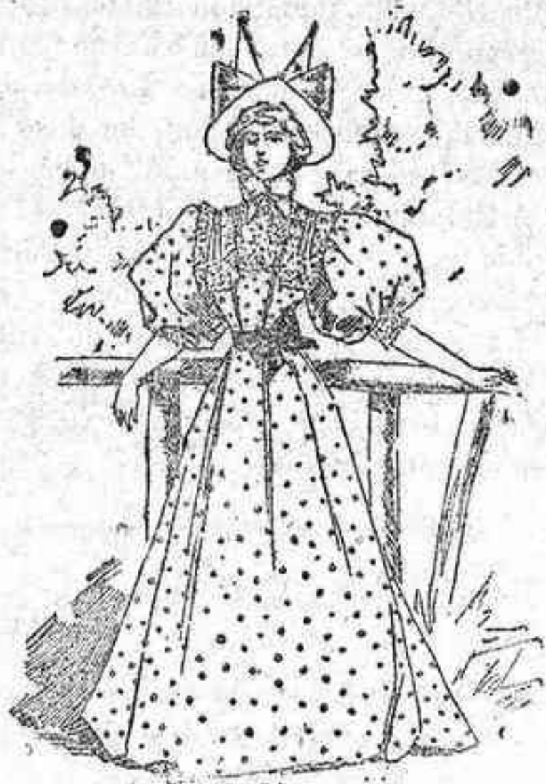
Traje para campo.

Modelos exclusivos para nuestras lectoras, de los grandes almacenes de «El Siglo», Barcelona. (1)