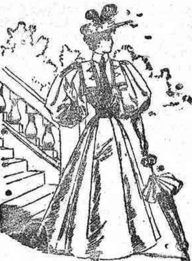
Otro traje para campo.

De batista fina; cuerpo forma blusa con una tabla floja en el delantero; cuello de encaje fino y entredoses caprichosamente combinados; mangas globo con puños tambien de entredós; cinta en la cintura, con un bonito lazo en el lado izquierdo; falda lisa forma campana.