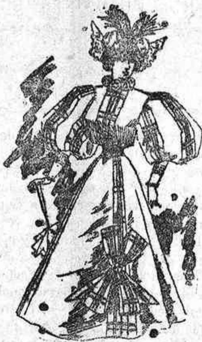
Traje para paseo.

piqué blanco; solapas formando cuello; dos botones á cada lado de aquellas, y alrededor de las mismas tres pespantes; cuello alto y vuelto; corbata de raso negro; cinturón de género igual; mangas cortas y flojas; falda lisa, forma campana.