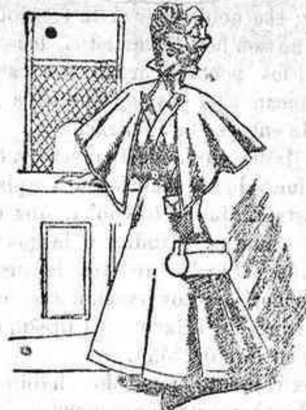
Traje para viaje.

Los tres vestidos que aquí se representan, con todos los detalles posibles en estos pequeños dibujos, obedecen á las últimas prescripciones de la moda, sin cuya circunstancia no aparecerían en este lugar, únicamente destinado á verdaderas y aceptables novedades. Así creemos haberlo demostrado, más de una vez, en este mismo lugar, y así hemos de seguir demostrándolo en directo obsequio á nuestras favorecedoras.