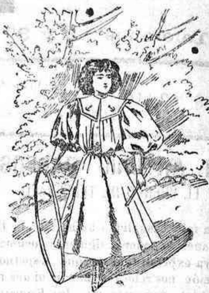
Traje marinero para niña.

ciopelo, en el centro; cuello de cinta, con un chou en cada lado; mangas cortas, forma globo; fajita de lo mismo y falda lisa, forma campana.