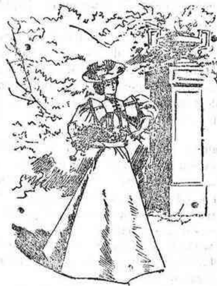
Traje para campo.

De alpaca; cuerpo ajustado y abrochado lateralmente; mangas al biés; esclavina, con vuelo, del mismo género; cuello alto y vuelto y alrededor de aquella un pespunte, sujetándola dos tiras de género igual, las cuales parten del cuerpo, cruzan en el delantero y se abrochan con un botón á cada lado; cinturón de cuero y falda lisa, forma capa, con un pespunte en el bajo.