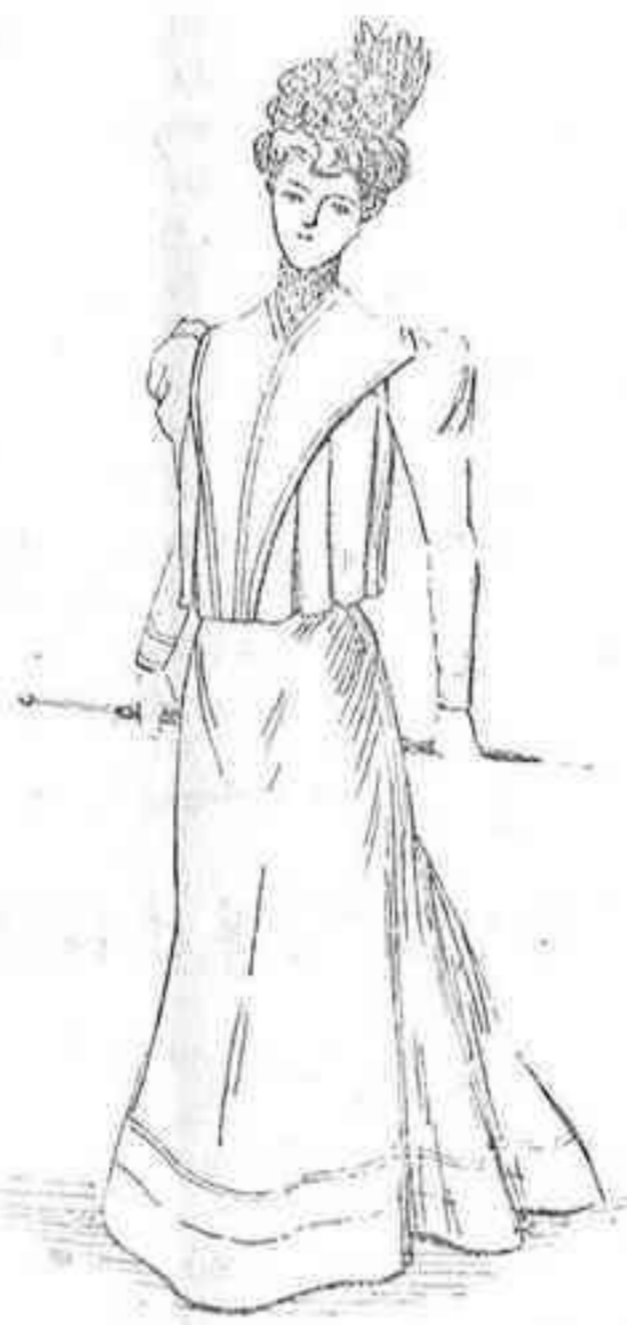
El último figurín

Precioso modelo de blusa suelta, con pliegues y cuello solapa en toda su extensión, llegando en su principio hasta los hombros. Confeccionése con tela de color muy claro. Esta blusa y la falda, acompañada y respuntada, son propias para el campo y para casa.