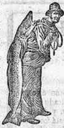
Obténgase siempre la Emulsión con esta marca «El Pescador», marca del procedimiento SCOTT I

porque ninguna otra está compuesta de los mismos materiales puros y vigorizantes (haciendo caso omiso del coste) por el procedimiento único de SCOTT, que asegura la perfecta asimilación. Sin «el pescador con el pescado» en el envoltorio, la emulsión no es legítima de SCOTT, que hizo otro hombre del Sargento Gallego, y que hará lo mismo con V. Emplee á usar la de SCOTT hoy, enviando á D. Carlos Maré, Calle de Valencia 333 Barcelona, 75 cts. en sellos, para que le remita una muestra gratis. En todas las droguerías y farmacias.