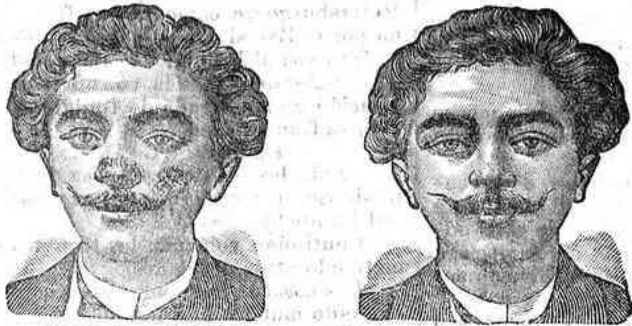
Antes de la curación. Después de 15 días de tratamiento

Curación de las enfermedades de la piel y también de llagas de las piernas LA SANGRE