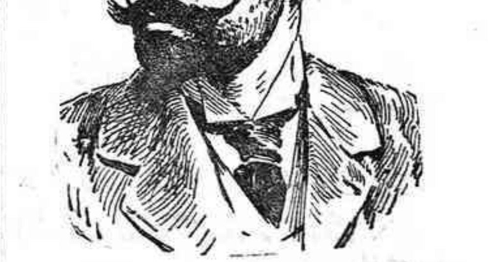
El ilustre dramaturgo Jacinto Benavente, que ha embarcado en Bremen (Alemania) para realizar un viaje de recreo, al par que de estudio, por Escocia, Islandia, el Archipiélago del Spritzber y el Círculo Ártico.