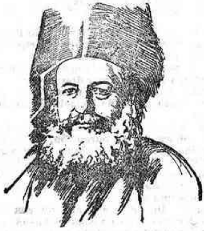
Monseñor Gasmas, patriarca ecuménico, jefe espiritual supremo de la iglesia ortodoxa griega, que ha protestado contra la persecución de los griegos en Turquía y la clausura de las iglesias y escuelas griegas del imperio otomano

Orden de pago Por Real orden se ha dispuesto que las Diputaciones provinciales procedan sin excusa ni dilaciones a satisfacer a los Consejos provinciales de Fomento las cantidades que por conceptos de personal y material vienen obligadas a abonar.