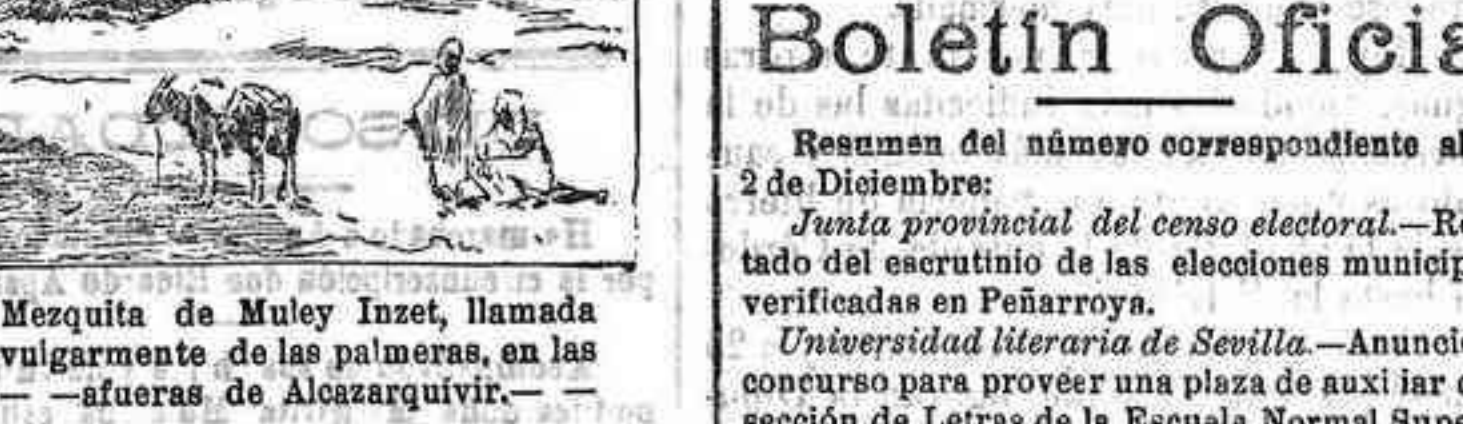
Mezquita de Muley Inzet, llamada vulgarmente de las palmeras, en las afueras de Alcazarquivir.

Otaciones del día 5 Efictos públicos españoles.—4 por 100 perpetuo interior, 78.75 pesetas.—5 por 100 amortizable, 98.55.—Cédulas hipotecarias 4 por 100 96.65. Valores de Sociedades nacionales.—Banco de España 454.00.—Compañía Arrendataria de Tabacos 296.00.—Banco Hipotecario 000. Valores locales.—Sociedad Eléctrica de Cañillas, 100.—Acciones de la Plaza de Toros, 1.500. Cambios sobre el extranjero.—París a la vista, 6.55.—Londres a la vista, 26.97. Metales preciosos.—Oreos antiguos, 7.55.—Id. nuevos 5.55.—Oreos antiguos, 6.55.—Idem nueva, 5.55.