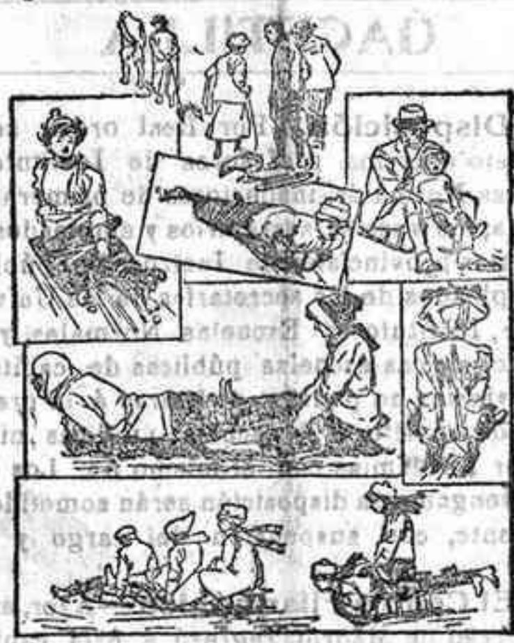
Solos, duos y tercetos de trineo.

El aparato sobre el cual se echa agerrado fuertemente el carrerista, desciende por pendientes de gran inclinación, recorre curvas muy peligrosas y termina dando un salto de algunos metros, que no siempre es efectuado con fortuna. La velocidad que en su marcha sobre la pista de nieve apisonada adquiere el corredor, es realmente vertiginosa y ahita de peligros, y buena prueba de ello es la frecuencia con que se ven en Saint Moritz, que es donde más carreras de «tobogan» se celebran, brazos en cabestrillo y rostros con amoratadas manchas ó cruzados por tiras de tafetán.