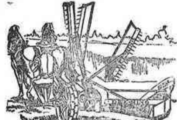
Segadora agavilladora DEERING

ARADOS Brabant MELOTTE y RUD-SACK. CULTIVADORES Planet.—GRADAS de muelle. SEMBRADORAS "San Bernardo", con cajón. DISTRIBUIDORA de abonos.—TRITURADORES de Grano— Abono y CORTA-FORRAJES .