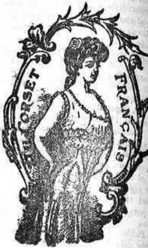
PLAZA DEL ANGEL, NUM. 8 CÓRDOBA