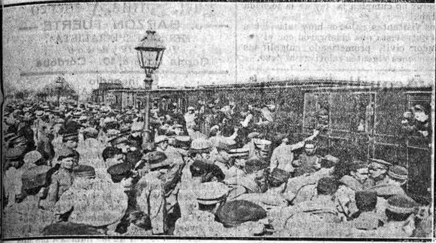
Aspecto de la Estación Central al partir el nuevo contingente de las fuerzas expedicionarias del regimiento de la Reina.