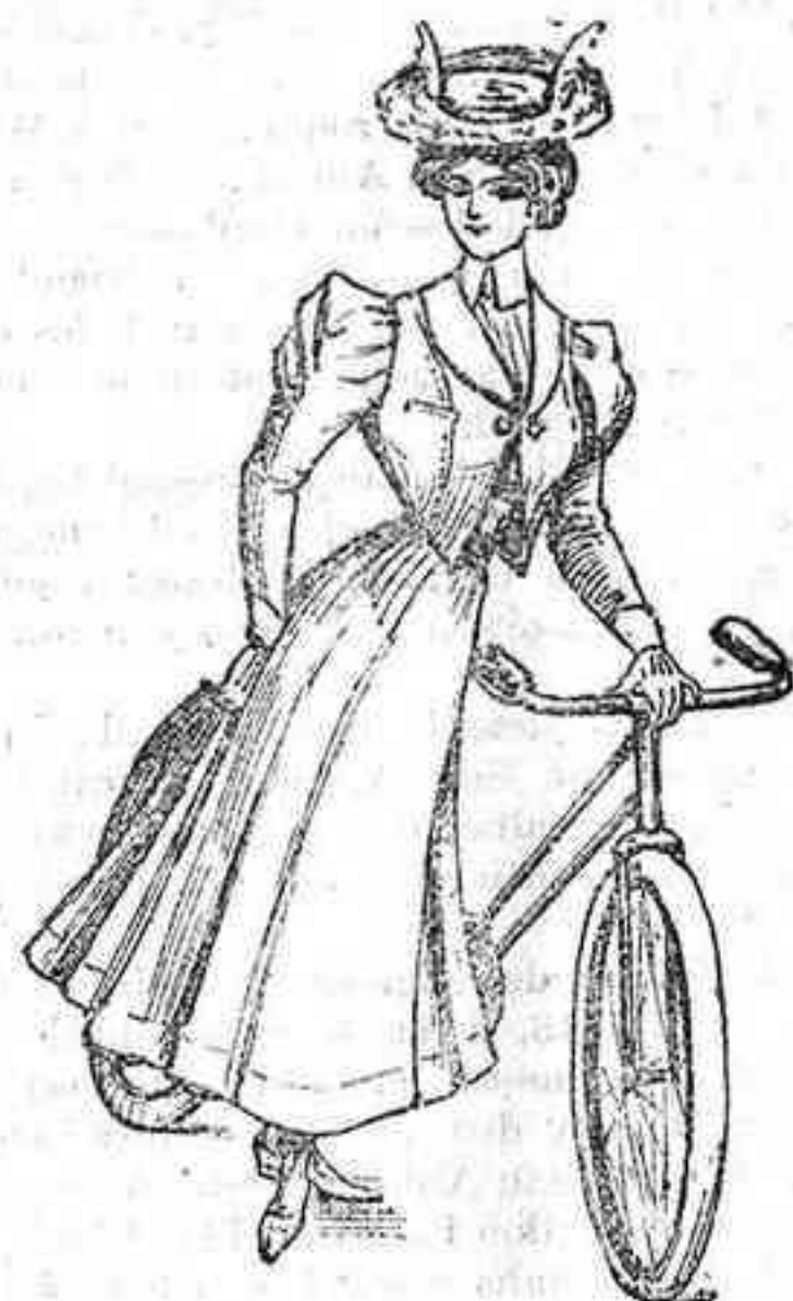
Traje para ciclista

El presente modelo, de tela de alpaca, color claro, es muy vistoso. Cuerpo americano con solapas smokeeng ; de lanterones entallados; manga alta, soufflé , recta en su caída y con cartera puño. Falda hueca, acampanada.