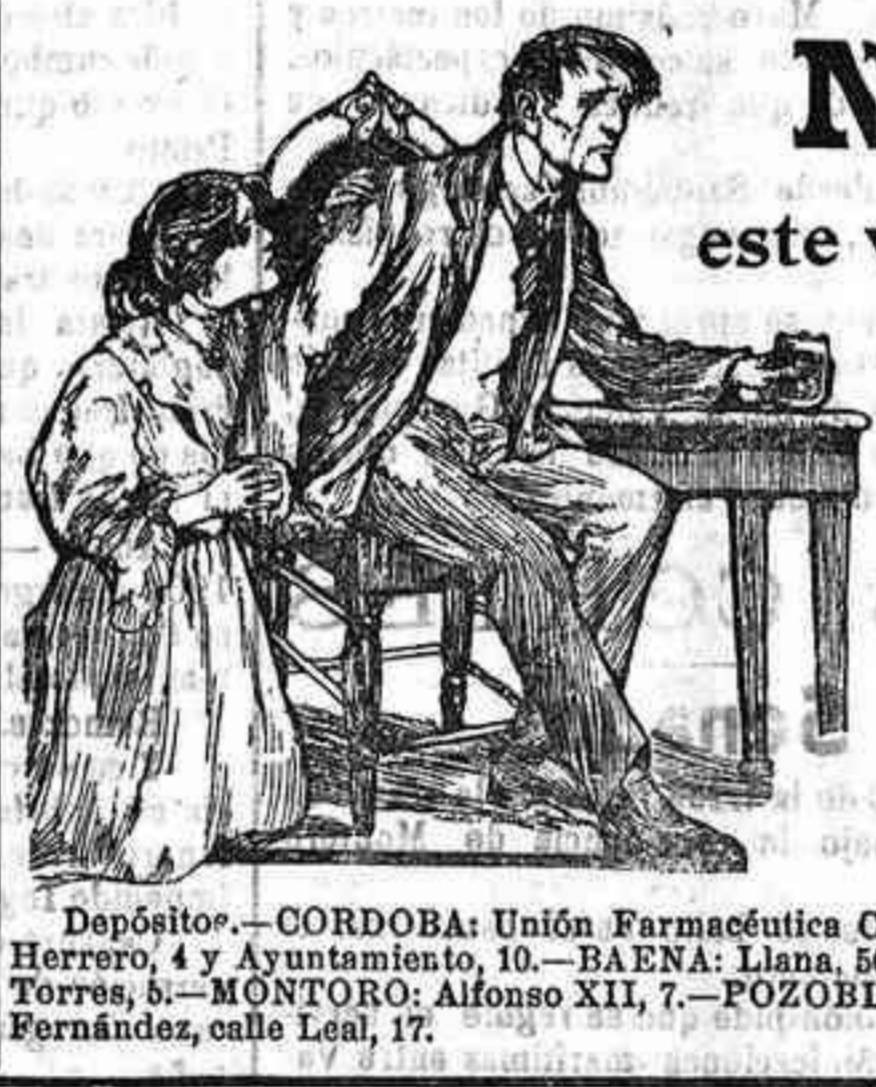
Depósito.—CORDOBA: Unión Farmacéutica Cordobesa, Conde de Cárdenas, 26; Duque de Hornachuelos, 10; Cardenal Herrero, 4 y Ayuntamiento, 10.—BAENA: Llana, 50.—BUJALANQUE: R. de Latorre.—CABRA: A. Cabello y Plá.—LUCENA: Torres, 5.—MONTORO: Alfonso XII, 7.—POZOBLANCO: M. Moreno.—VILLAFRANCA: J. R. de Torres.—BELMEZ: J. Fernández, calle Leal, 17.

Fuera CANAS Desaparecen como por encanto con el uso del AGUA VIRGINAL PROGRESIVA No mancha el cutis ni la ropa. Resulta en absoluto de manera de plato y de cualquier material. Precio del frasco 2'50 pta. DE VENTA En la droguería Universal, calle Conde de Cárdenas, número 21, Córdoba. Venta de enclas y chaparros.—Se han señalado para cortarlas desde el día, en el cortijo "La Morena", 190 enomas y chaparros. Para su precio y condiciones puede verse á don Rafael Ayustante, Saravias, 5. 10-4 Se venden un aparador y una mesa de comedor. Informarán, Jesús María, núm. 2. 5-3 Se vende una cama de matrimonio, dorada y negra, en la calle Alonso de Burgos, núm. 31. 5-5