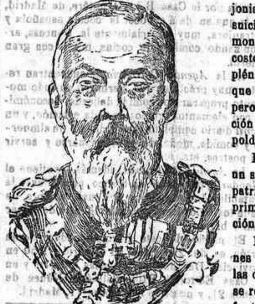
El príncipe Luitpoldo

Fué el príncipe cuya muerte llora hoy todo Baviera, un soberano de austeras costumbres, amante de la vida patriarcal, todo bondad y dulzura, que supo desde los primeros momentos conquistarse el afecto y la admiración de su pueblo. La familia real de Baviera, durante varias generaciones víctima de una de las más horribles dolencias, es de las de más ilustre abolengo de Europa, pues su origen se remonta a los Carlovings, y, sin duda alguna, el difunto Luitpolo pasará a la Historia como uno de los que más honra y prez la han dado.