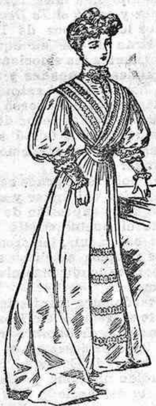
El último figurín

Toilette de paño, color malva, con elegantes pliegues. Pecherín de tres órdenes rodeando un cuello triangular. Cinturón de piqué, con lazo. Mangas fantasía.