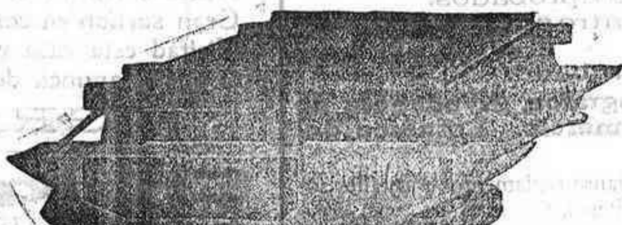
TRILLO ROTATIVO DE GRAN TRABAJO para una sola yunta de mulos.