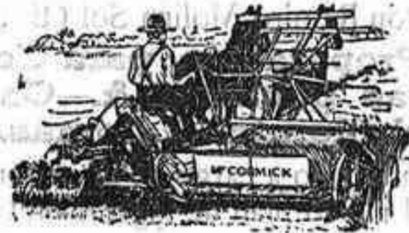
Alfadoras Macormick — ULTIMA PERFECCION —