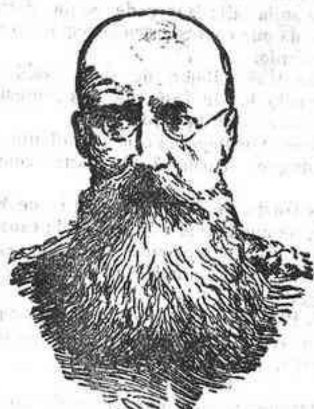
FIGURAS DE LA GUERRA. El general Iwanoff que manda el ejército ruso del Sur.

Con el objeto de satisfacer la creciente demanda de ejemplares del DIARIO y para mayor comodidad del público, los números sobrantes de la tirada corriente quedan puestos a la venta en los kioscos de las Puercillas, la calle del Conde de Gondomar y la Estaci6n, dejándose de venderlos en la Administraci6n de este periódico.