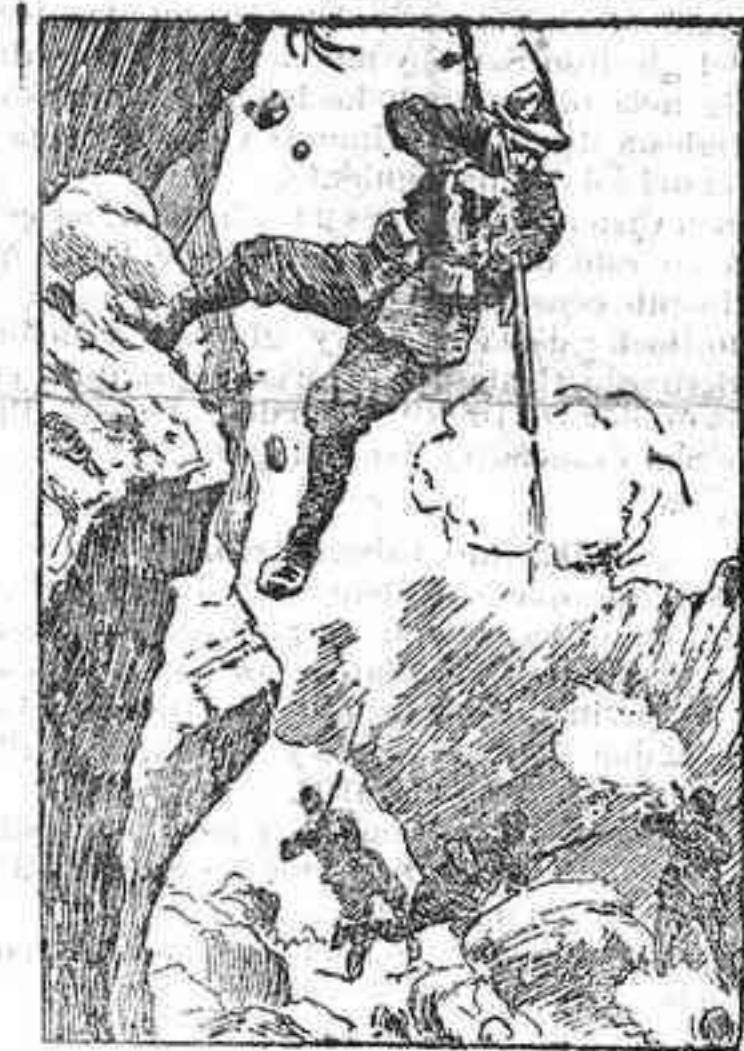
COMO SE PIELA EN LOS ALPES. Cazador alpino italiano, tiroteándose con una patrulla de cazadores austriacos.