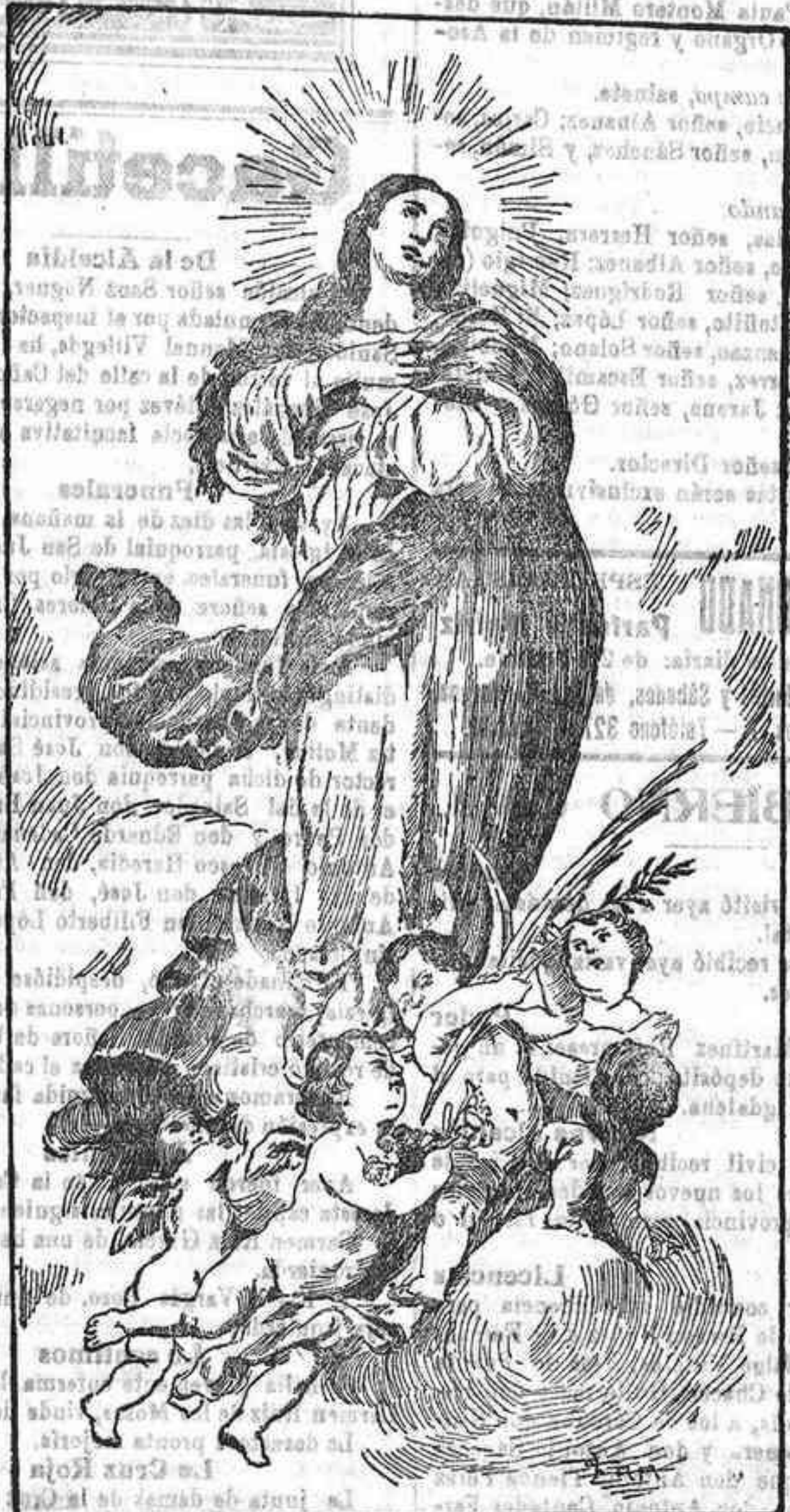
La Purísima de Muñillo

No será posible el conflicto entre el poder real y el parlamentario, por que surgirá el fallo