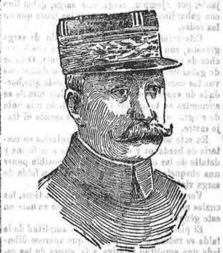
El general Patin, a quien el Gobierno francés acaba de elevar al alto puesto de jefe del Estado Mayor General.

Cambios sobre el extranjero.—París a la vista, 79'75.—Londres a la vista, 81'65.