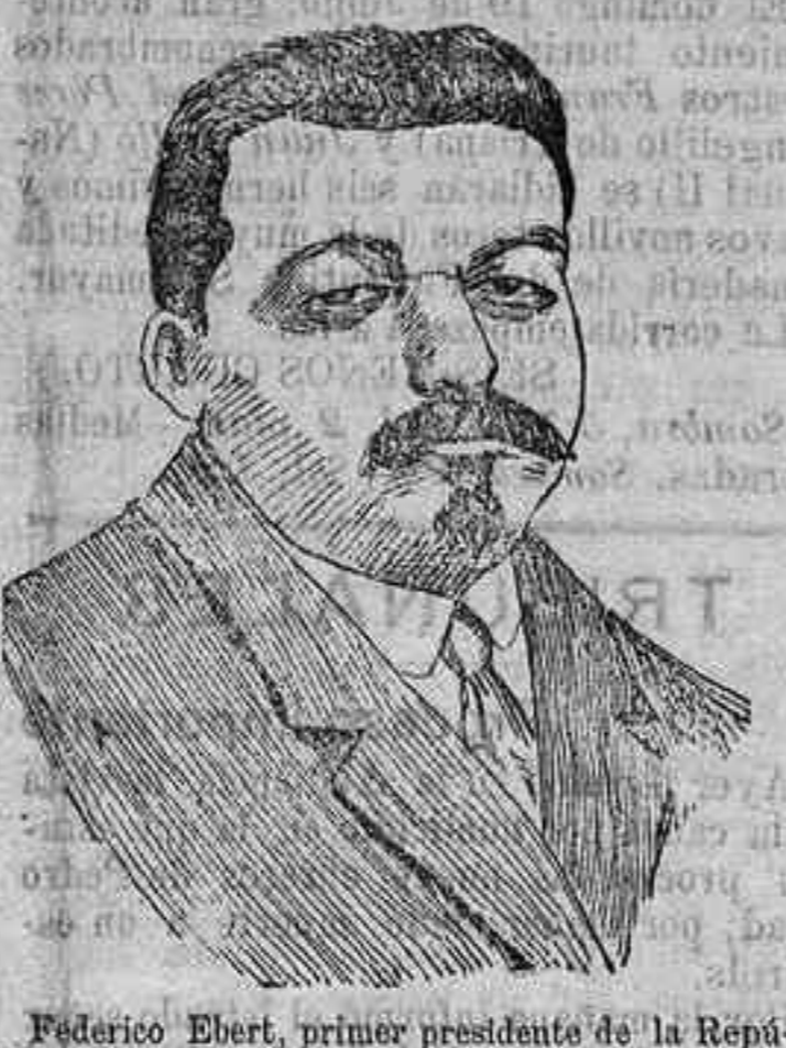
Federico Ebert, primer presidente de la República alemana, que se encuentra enfermo de algún modo.