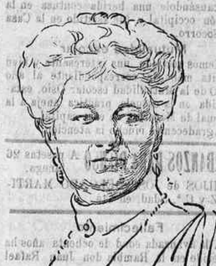
La exemperatriz de Alemania, Augusta Victoria, que ha fallecido en Dom (Paises Bajos).