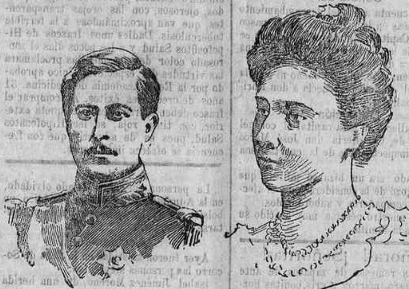
Los Reyes de Bélgica, Alberto e Isabel de Baviera, que durante su estancia en Madrid han sido muy agasajados.