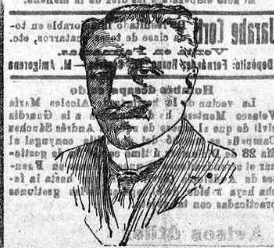
Mr. Paul Deschanel, que ha sido nombrado Presidente de la República Francesa.