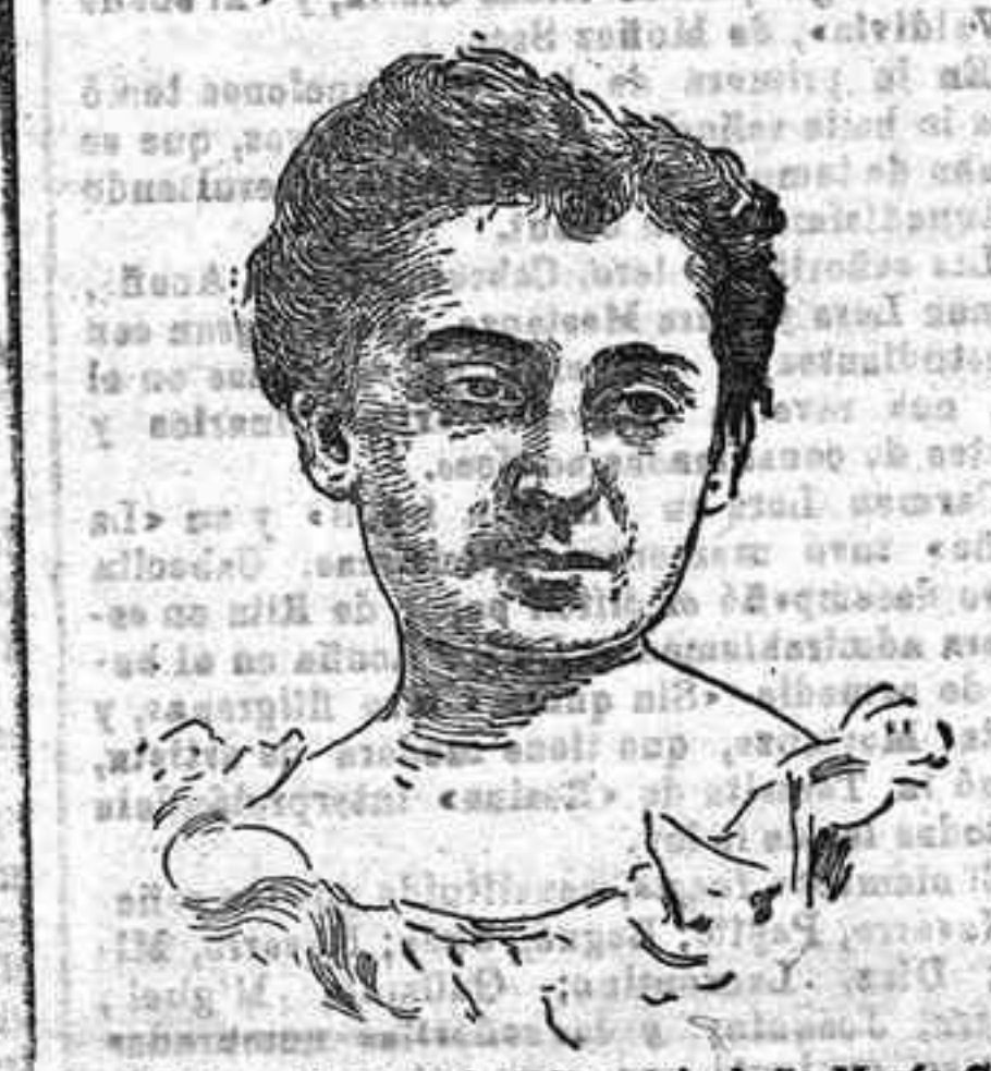
La distinguida y ominente actriz doña María Guerrero, que se halla grave a consecuencia de una pulmonía.