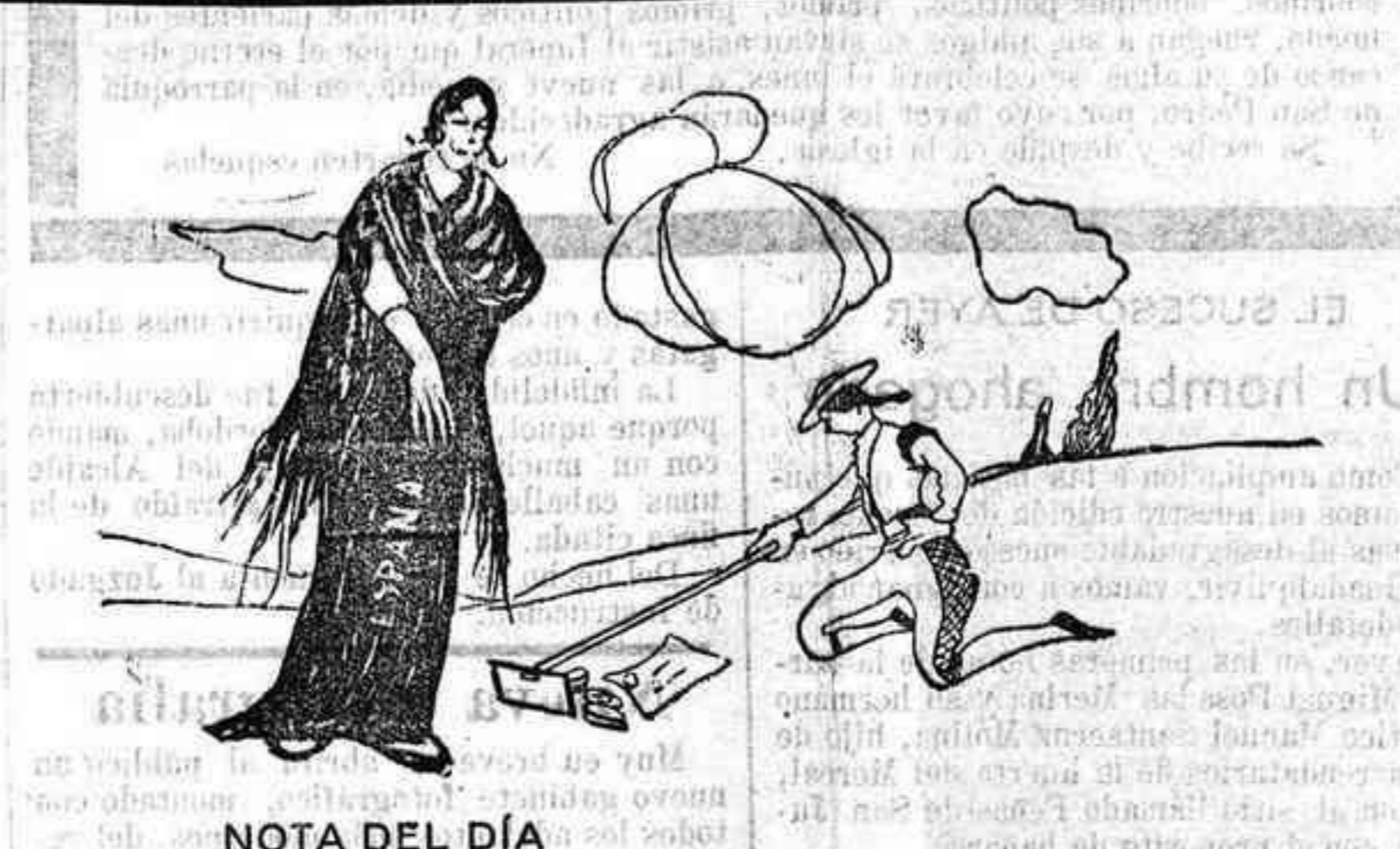
NOTA DEL DIA La madre.—Niño, deja el juego y vamos a ver si encontramos pan.