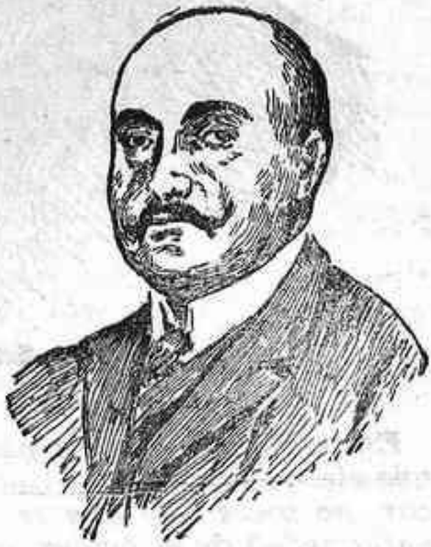
El ilustre político húngaro Francisco Kossuth, jefe del partido de la independencia de Hungría, que acaba de fallecer.