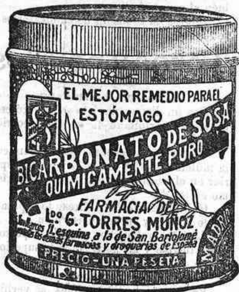
Cuidado con las imitaciones, que son perjudiciales

LEON ORNSTEIN.-Madrid Mariana Pineda, núm. 5