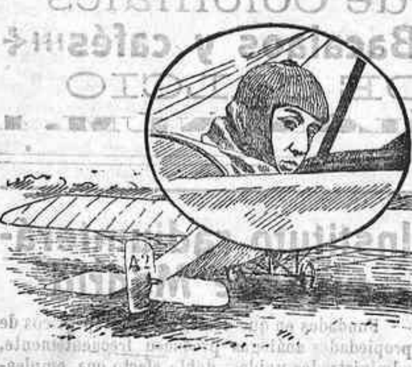
Nuestros aviadores militares