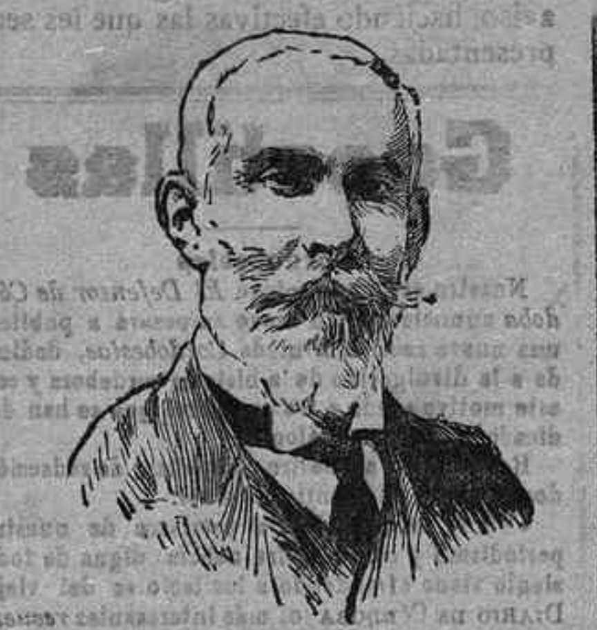
D. Rafael Altamira, representante de España en París ante el Tribunal arbitral que entiende en las cuestiones de Marruecos.

Reciba nuestra enhorabuena el matrimonio por este grato suceso.