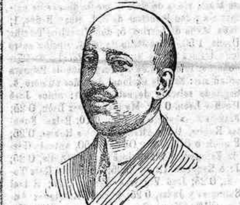
Gabriel D'Annunzio, el distinguido escritor italiano que al frente de un regimiento de granaderos se ha apoderado de Fiume.