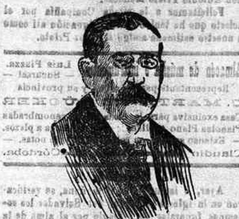
Herr. Nogke, ministro de la Defensa de la Social democracia alemana.

Clinica RONCAL ESPECIALISTA: Garganta, Nariz, Oído LABORATORIO.—Consulta de 1 a 5. Braulio la Portilla, 6, pral. Córdoba.