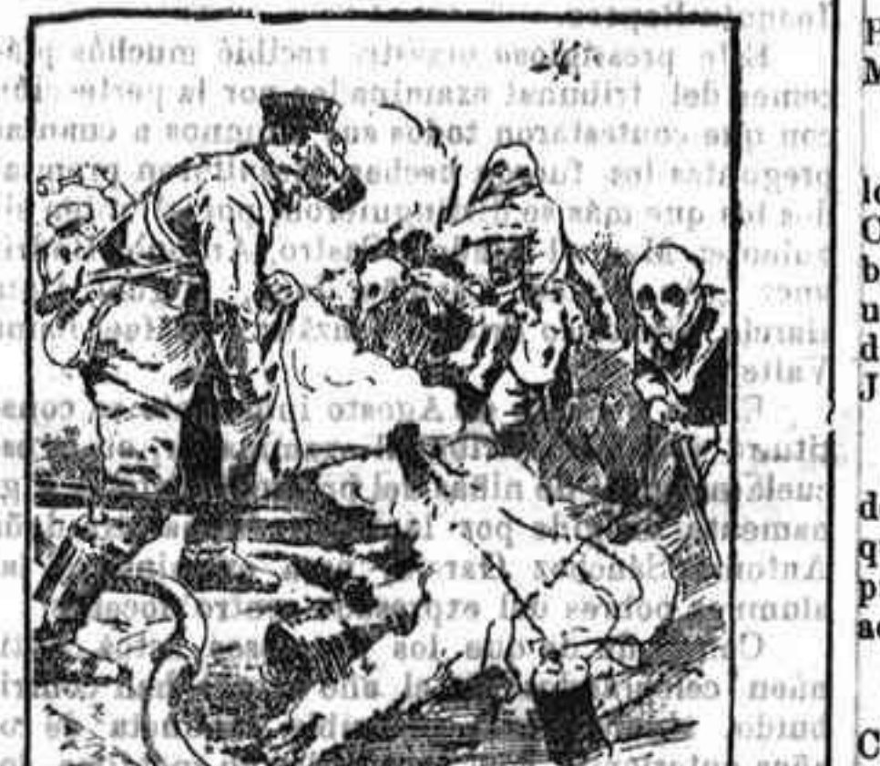
DE LA OFENSIVA FRANCO-INGLESA.—Un combate en medio de gases sulfurosos, por medio de granadas de mano y bayoneta.