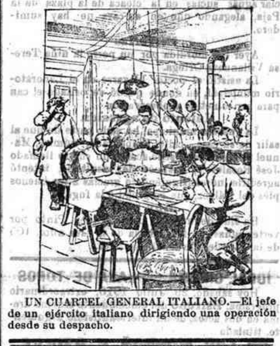
UN CUARTEL GENERAL ITALIANO.—El jefe de un ejército italiano dirigiendo una operación desde su despacho.

Segundo ejercicio.—Consistirá en copiar un mismo modelo, de un fragmento de ornamentación sacado a la suerte, entre varios que tendrá dispuestos el Tribunal. Para la práctica de este ejercicio, oportunamente señalará tiempo el Tribunal. Tercer ejercicio.—Consistirá en el copiado de una estatua, en papel de 1'10 por 80 centímetros, que el Tribunal designará oportunamente, así como también el tiempo para la práctica de dicho ejercicio. Cuarto ejercicio.—Consistirá en el copiado, en colores, de un estudio del natural, que el Tribunal designará oportunamente. Quinto ejercicio.—Consistirá en la práctica de un estudio de Composición decorativa, a elección del opositor. En todo lo que no esté determinado en este programa especial, el Tribunal se sujetará al Reglamento general de oposiciones vigente. El cuestionario para el primer ejercicio estará a disposición de los señores opositores desde el día 7 de Agosto, y a las horas laborales, en la Secretaría de la Escuela. Córdoba 21 de Julio de 1916.—El Presidente del Tribunal, Dionisio Pastor.