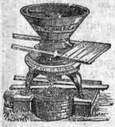
MOLINO AMERICANO PARA CABALLERIA ESPECIAL PARA TRITURAR GRANOS GORDOS

Tenemos también otros modelos diferentes, construcción inglesa para ser movidos a brazo y a motor