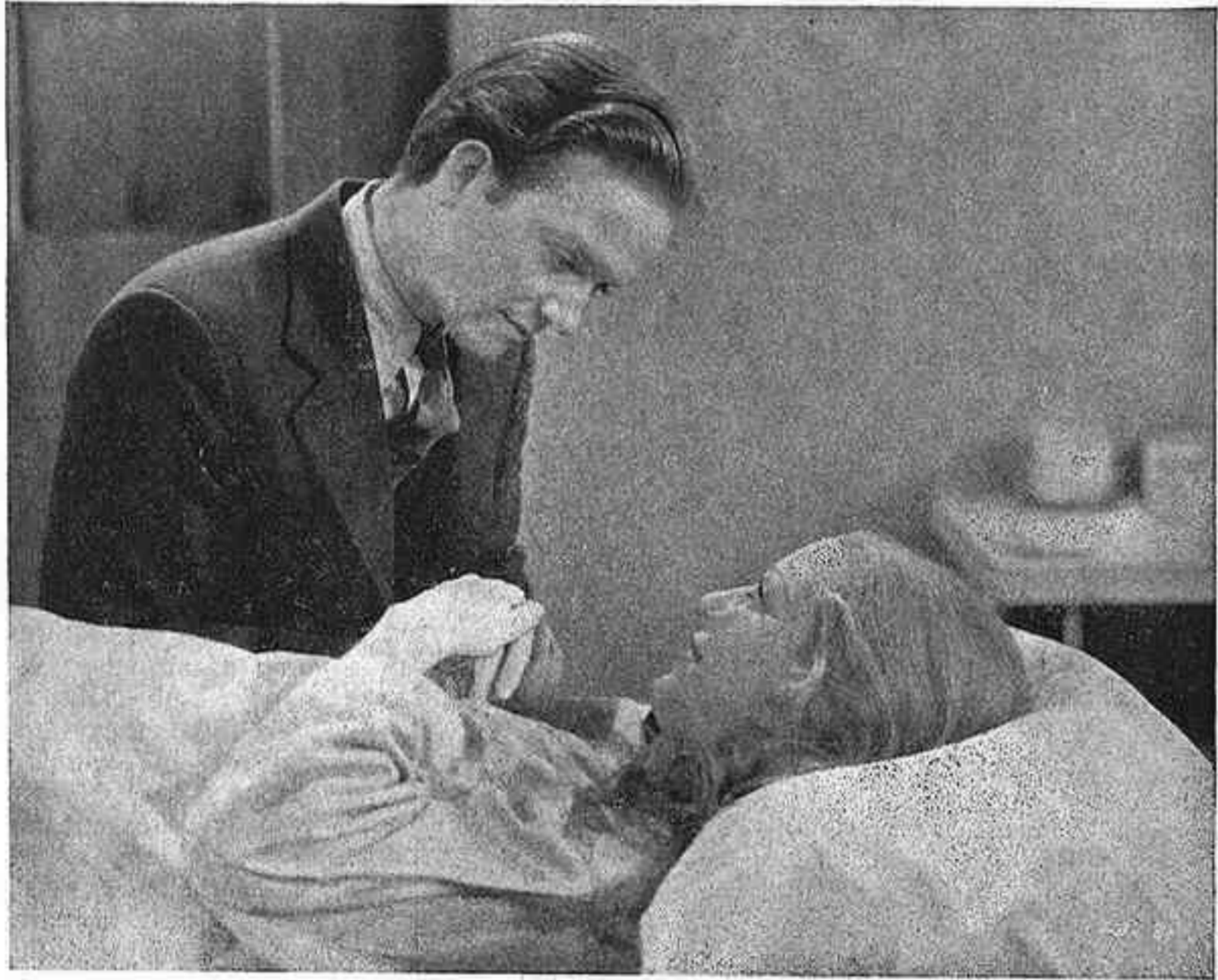
«La vida comença»

La vida comença , realitzada per James Flood i Elliot Nugent, és una pel·lícula massa excepcional — excepcional perquè és única dins el gènere — per no recomanar-la als nostres lectors. Una pel·lícula que transcorre tota ella dintre les parets d'una clínica de l'Estat destinada a l'assistència de les dones en el trànsit de la maternitat. La sala d'operacions, la sala on les futures mares allitades esperen el moment, el corredor on els futurs pares es morfonen d'im-