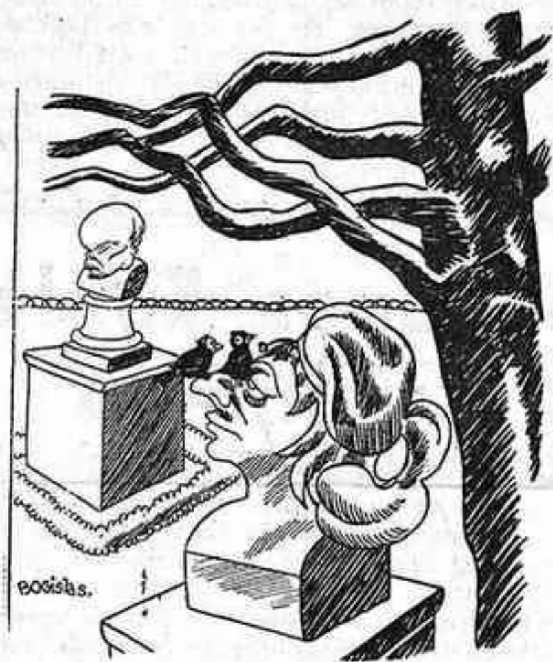
PUNT DE VISTA DE L'OCELL

L'altre dia, a migdia i 22 minuts, un speaker del Poste Parisien donà compte del següent fet divers: «Un boig alcohòlic ha tallat el coll de la seva dona amb un ganivet en forma de serra. El cadàver ha estat conduït a l'Institut Médico-legal.» I immediatament, sense ni un segon de transició, un segon speaker , continua amb veu esclatant: «Beveu vi. Viviu alegres!»