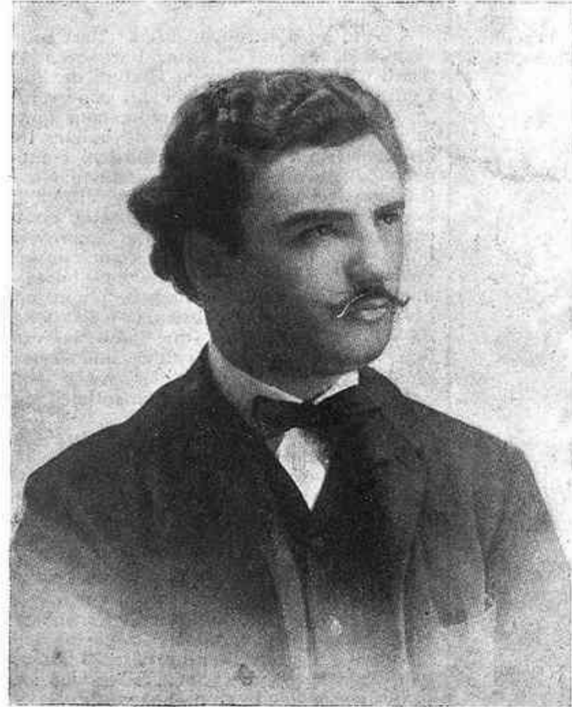
Francesc Pujols quan guanyà la Flor Natural

divinitat del panteó català: en evocar aquest magnífic talent el nostre esperit es prosterna i venera.