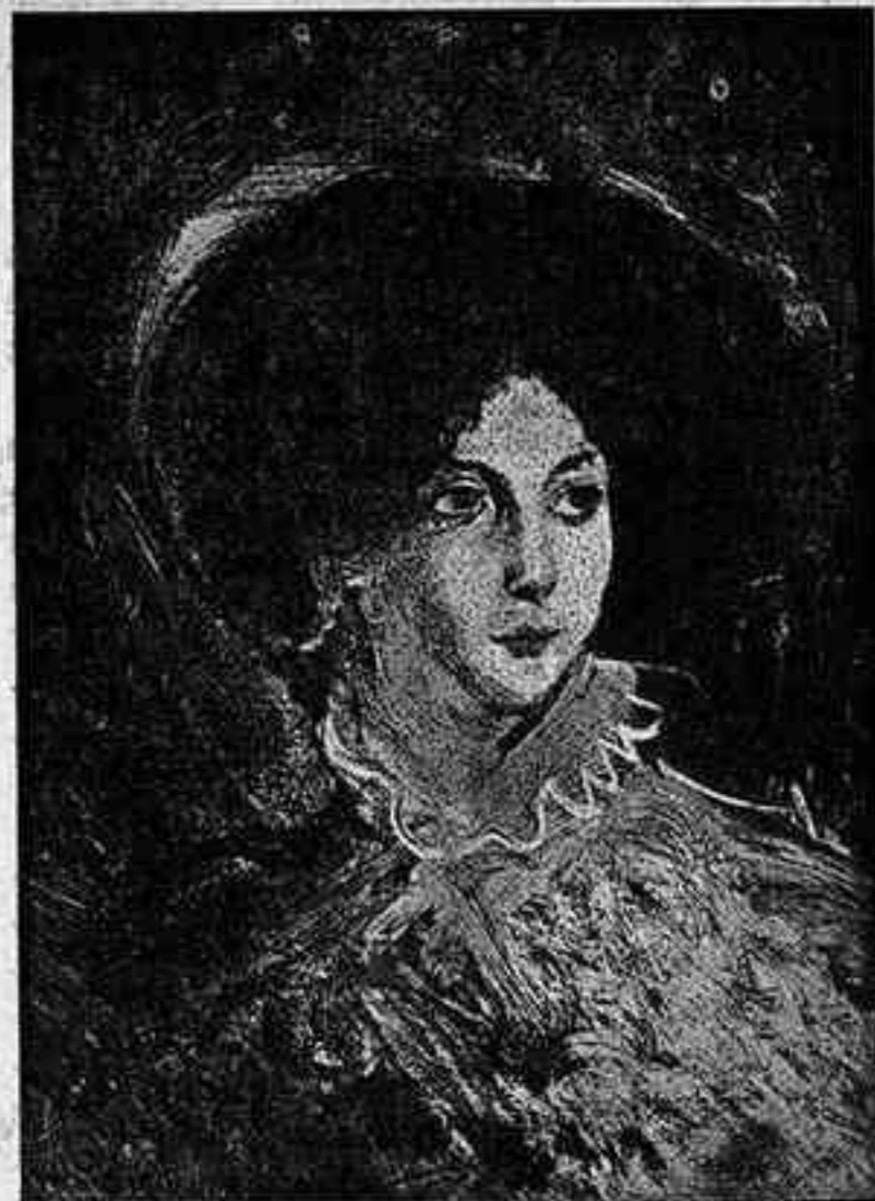
E. DELACROIX: «RETRAT DE MRS. DALTON»

Aquesta vastitud sintètica, immensa i imprecisa, inherent a les creacions que provenen directament de l'inconscient, vastitud que contrasta tant amb la migradesa eixarxada dels anàlisis penosos i limitats que els racionalistes fan "a posteriori" de les troballes dels autènticament inspirats; aquesta sintètica vastitud, doncs, no es fa solament visible en el contingut intern i simbòlic de l'obra d'art, sinó que també es percep amb corpenedora evidència en allò que superficialment sembla el més extern de les produccions artístiques: la tècnica i els seus diversos procediments. Examineu atentament, si no, com a prova, aquesta excel·lent mostra de l'obra de Delacroix que reproduïm, contempleu aquests dramàtics i tempestuosos "Cavalls salvatges atacats per tigris" amb atenció escrutadora, i no tardareu pas molt a descobrir els elements