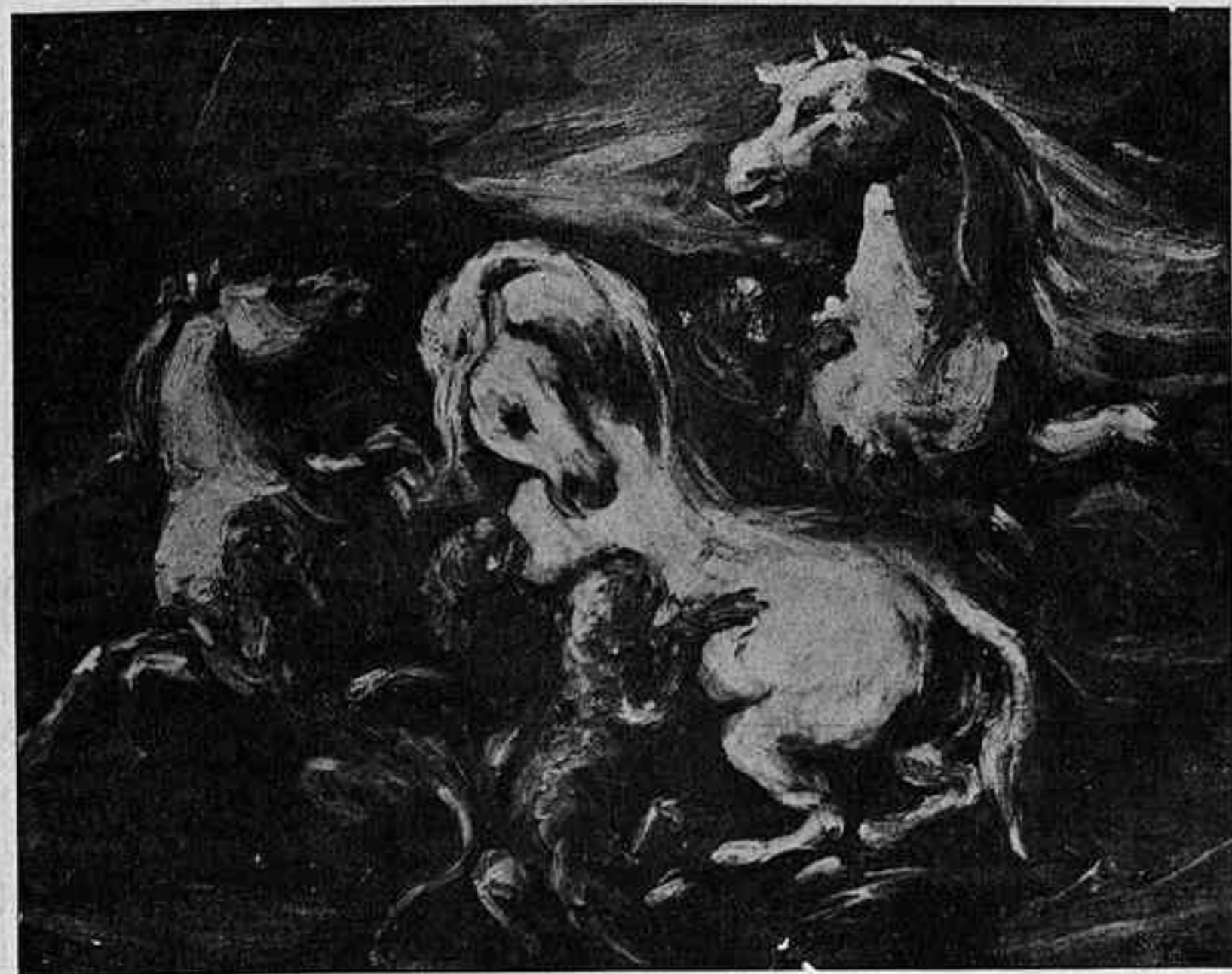
E. DELACROIX: «CAVALLS SALVATGES ATACATS PER TIGRES»

dàvem molt bé de presentar aquestes dues teories en oposició netament antitètica, com si no hi hagués possibilitat que entre l'una i l'altra pogués subsistir com una "síntesi" superadora que, en unir-les, aplegués llurs excel·lències tot i eliminant-ne les limitacions.