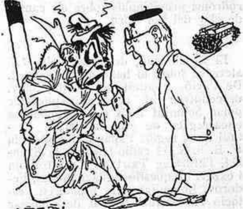
—Què t'ha passat? —Sí, mira: se m'ha ocorregut baixar del tramvia.

Abans de la guerra europea, allò que els francesos anomenen "grivèlerie" — és a dir, l'art de menjar i beure sense tenir diners per a pagar — feia part de l'humor. Rossinyol, Cases i Clarassó, havien practicat la "grivèlerie" amb una gràcia inimitable. I, més ençà, pel Grill Room, encara s'arrossegaven alguns bohemis que no havien perdut el sentit de la facècia, i que, emposos per la necessitat, se les empecaven totes per a consumir d'arròs. I un dia, l'un d'ells, un pintor, que no en portava ni cinc, va proposar a un músic amic, que es trobava en la mateixa situació desesperada, de beure un aperitiu a duo. —Com ens ho farem? — va preguntar el músic. —Deixa'm fer! I s'instal·laren a la terrassa d'un cafè de la Plaça del Teatre. El pintor cridà: —Noi! Un vermut! Quan li portaren la consumació demanada, digué: —No; m'heu pagat el "picon", en lloc d'això. El cambrer s'emportà el vermut i serví un "picon". Els dos artistes begueren sense presses. Després fugiren corrents. El cambrer els aconseguí: —No m'heu pagat el "picon"! El pintor replicà: —Perdoneu! No havia pas de pagar-vos-el. L'heu canviat per un vermut. —Sí! Però el vermut, tampoc no me l'heu pagat! —Però no l'heu pas begut. —Es veritat — contestà el cambrer, inclinant-se davant aquest raonament irreprotxable.