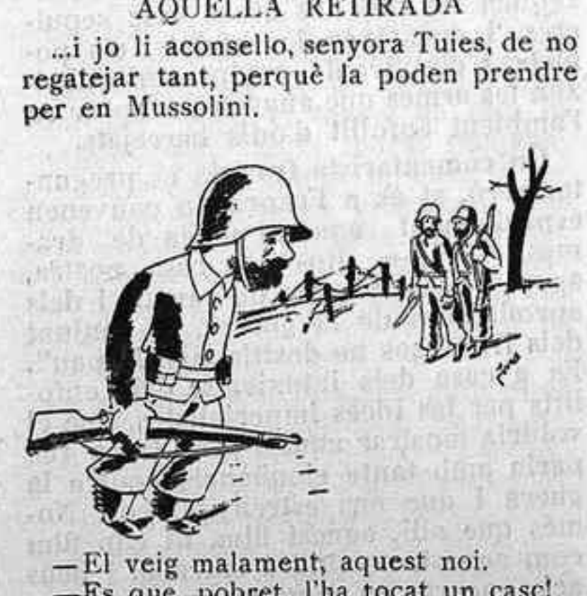
—El veig malament, aquest noi. —Es que, pobret, l'ha tocat un casc!