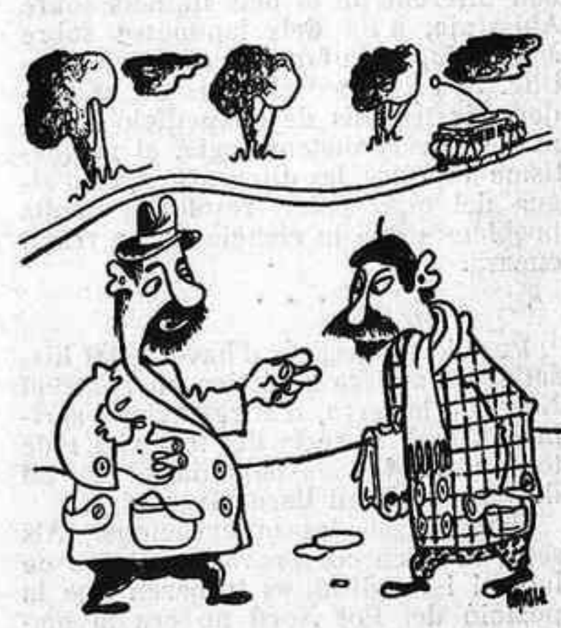
—Que està molt lluny, de casa seva? —Molt. Quinze tramvies.