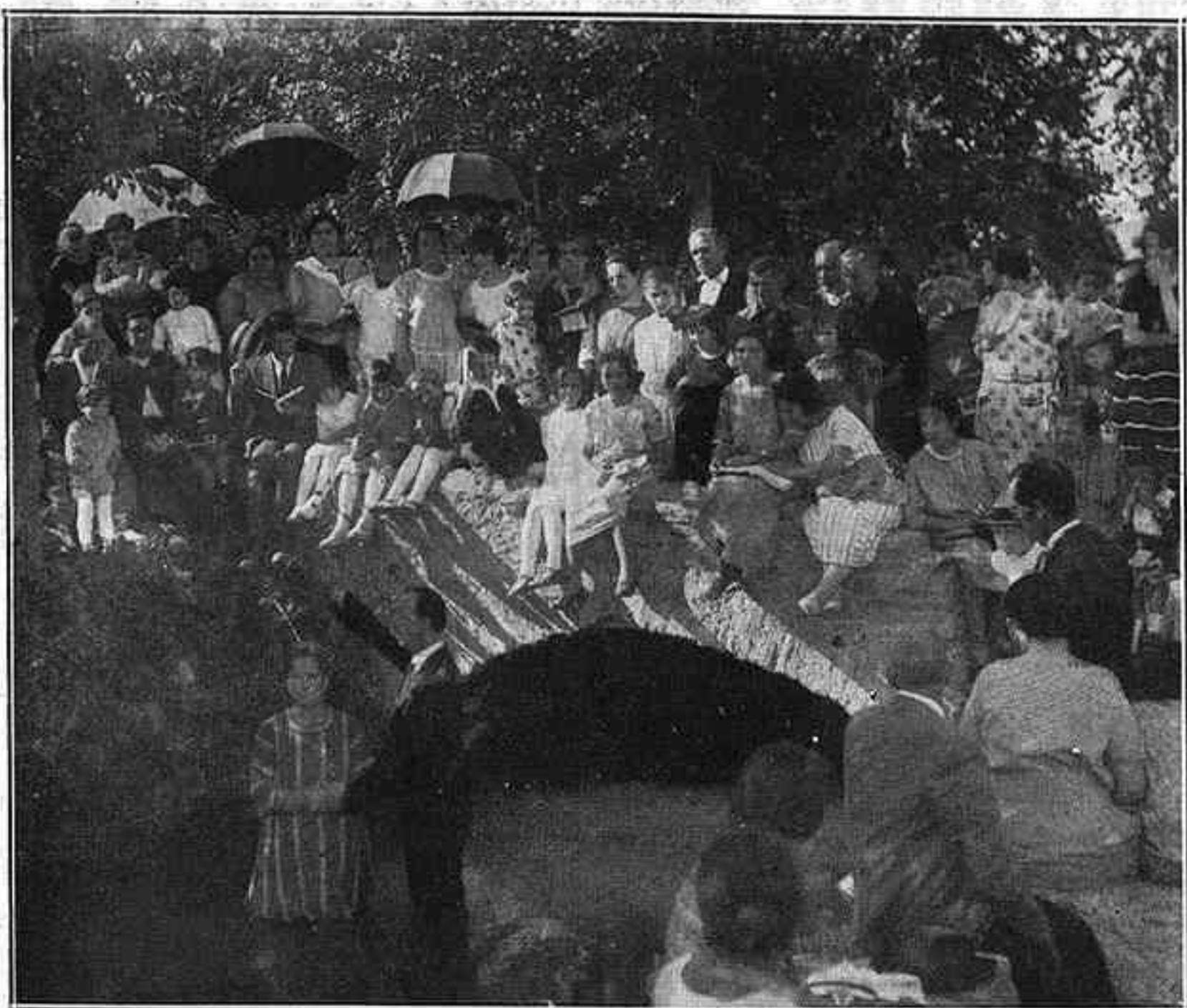
Un bateig adventista al Rec Comtal, afores de Sant Andreu

Són dintre el rec. L'aigua els arriba a mitja cuixa. Aleshores, en mig d'un silenci que només interromp el petament de dents de la dona que està a l'aigua, el Pastor li agafa les dues mans amb la mà esquerra i alcant la dreta, oberta, en l'aire, diu amb veu greu i emocionada: — Querida hermana. Por tu profesión de fe, yo te bautizo en el nombre del Padre, del Hijo y del Espíritu Santo. Les dones sangloten. Alguns criden: —Germana! Germana! Llavors la dona, sostinguda pel Pastor, inclina el cos endarrera fins a submergir-lo completament dins de l'aigua. Surten xops, però radiant. Els germans s'abraonen a la batejada i la besen. La germana Maria, les llàgrimes als ulls, crida, exultant: —Ja tenim una germana més!... Ahhhhhh!... Alleluia!... JOAN ALAVEDRA