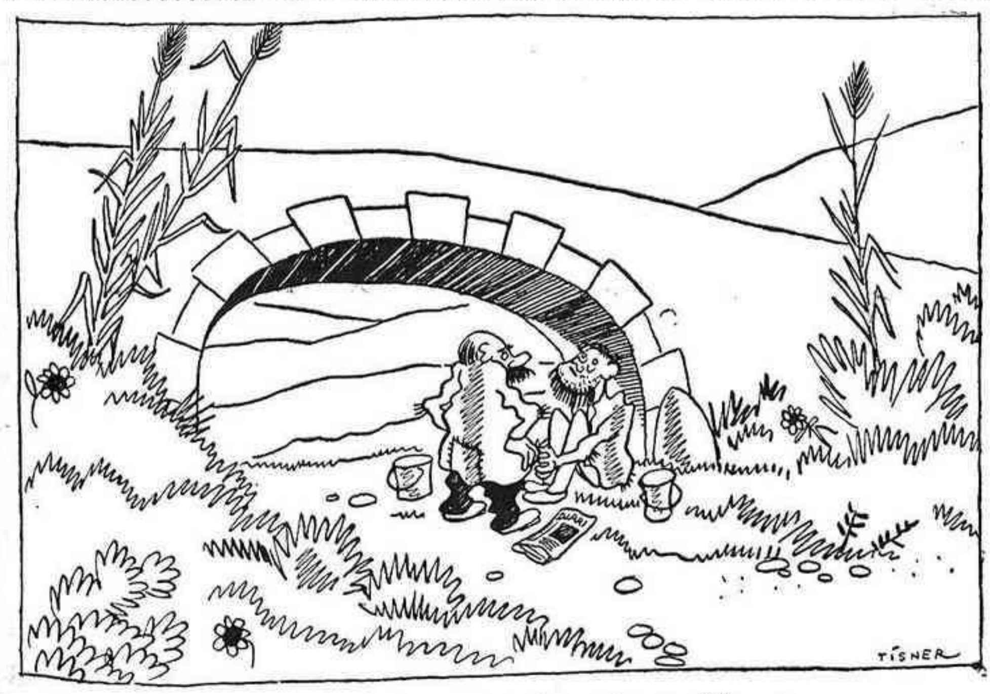
—Dia que ara anirem tan bé, que ja han tornat les finques als grans d'Espanya.

La llei tal com és Artículo 1.º La ley de Reforma Agraria de 15 de septiembre de 1932, regirá íntegramente en todo el territorio nacional. Quedan exceptuados todos los artículos de la ley de 15 de septiembre de 1932. Artículo 2.º Queda derogada la base octava de la ley de Reforma Agraria en cuanto autoriza la expropiación sin indemnización de fincas rústicas y en los demás extremos que se opongan a la presente ley de reforma de la Reforma. Artículo 3.º Para articular la presente ley con la de Restricciones, serán pagados a los grandes de España 577 millones para indemnizarles las propiedades expropiadas. Artículo 4.º Los 577 millones se pagarán a los grandes de España para resolver el angustioso problema del paro forzoso, que tan funestas consecuencias tiene en todo el mundo. Artículo 5.º Los grandes de España contribuirán con el 10 por 100 del precio de la expropiación al ensanchamiento de la base de la República. Aquest núm. d'El Be Negre ha passat per la censura