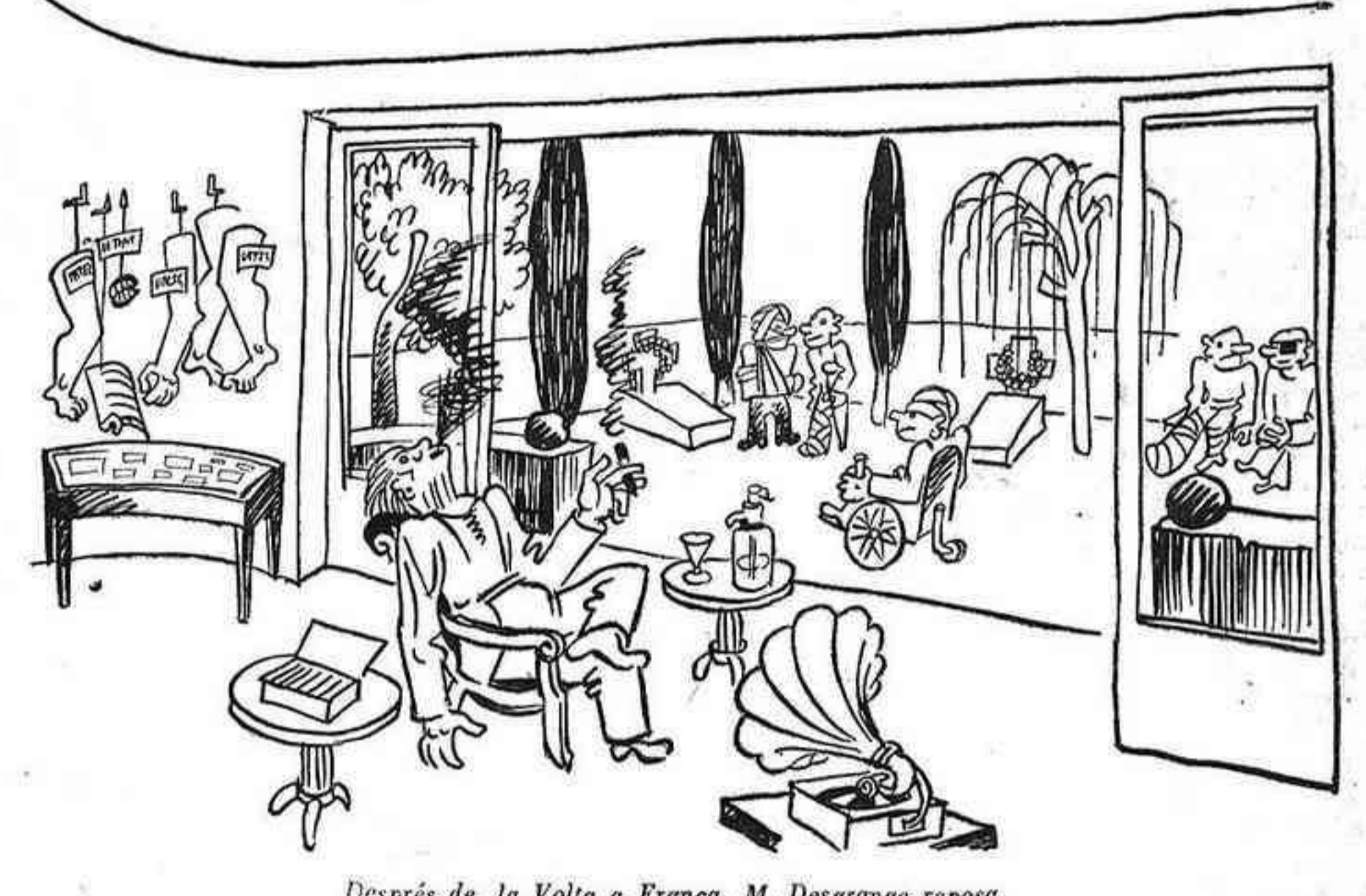
Després de la Volta a França, M. Desgrange reposa.

Hem estat pregats de fer constar que és a Atenes, i no a Madrid—tal com s'hauria pogut creure—que el President del Consell ha exigit la dimissió dels republicans que formaven part del ministeri. Al senyor Leroux encara no se li ha ocorregut semblant cosa.