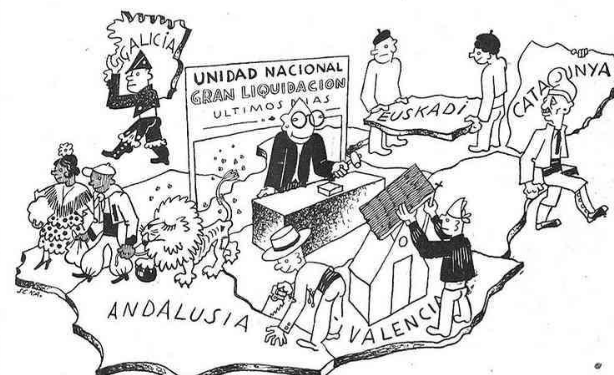
FINALS DE TEMPORADA

Tampoc és cert que l'home que vivia amb la carnissera, arribat impensadament, tanqués la nevera. És menys veritat, encara, que una estona després, hom tregués de la nevera l'inopòrtit visitant i que hom el fiqués, viu encara, en un cotxe conduït pel fill de l'home que vivia amb la carnissera.