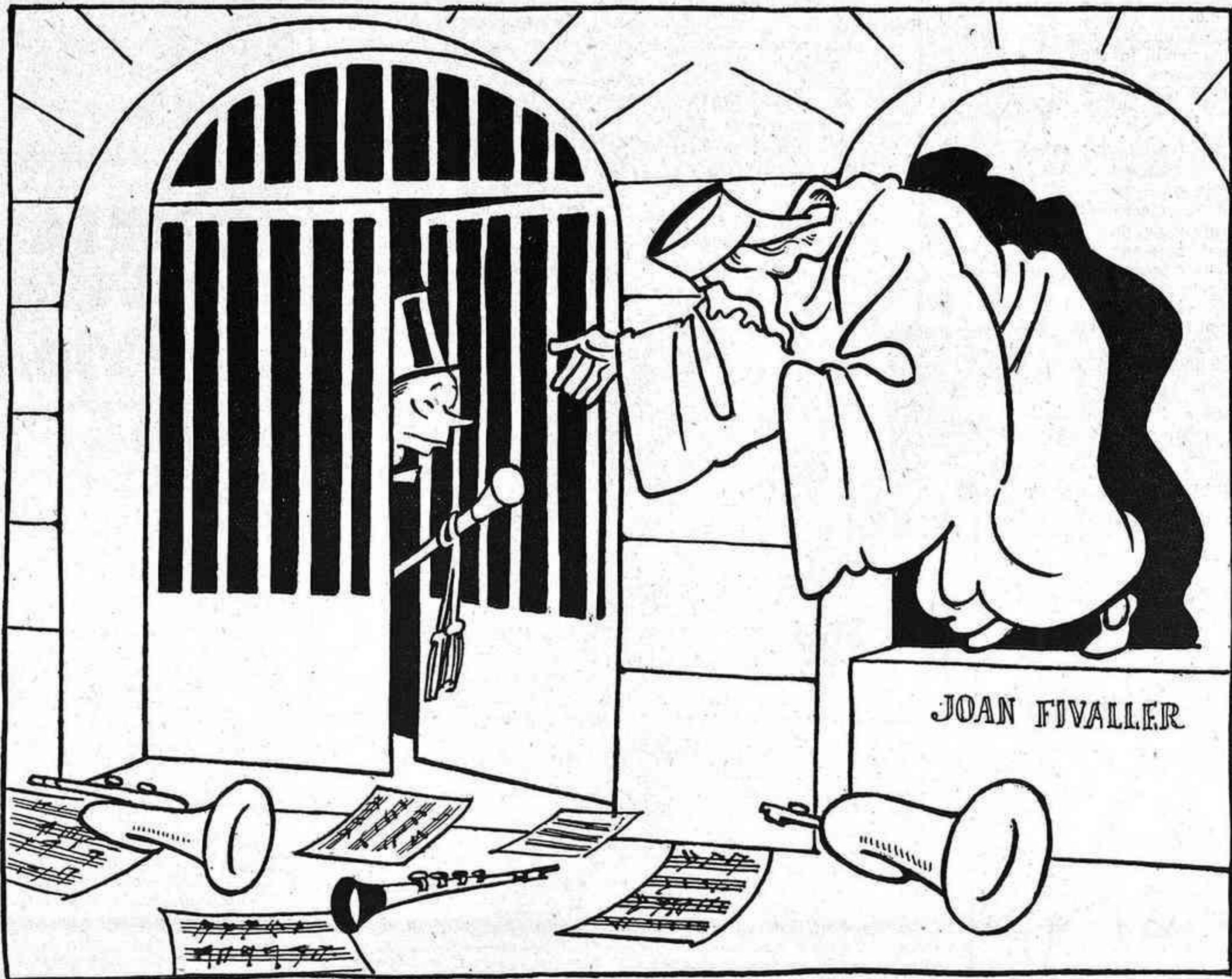
A L'HORA DE LES PATACADES

A la pàgina 3, el reportatge sensacional: Les devocions del senyor Pich i Pon.