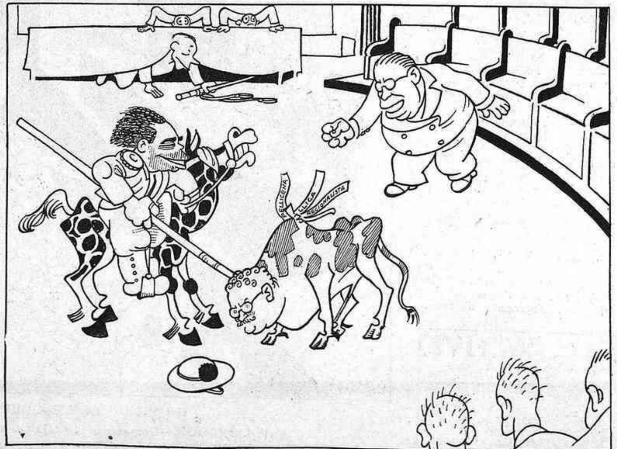
DE LA DARRERA SESSIÓ MUNICIPAL — En Giralt: Más varas! Más varas!