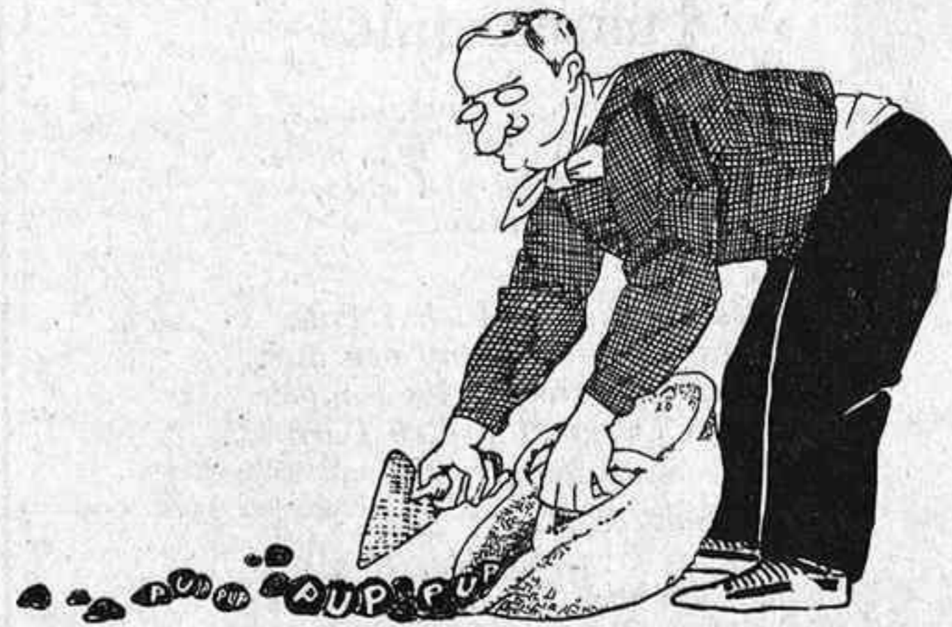
— D'Emperador del Paral·lel a President de la República del districte IV o "Lo que va de ayer a hoy".