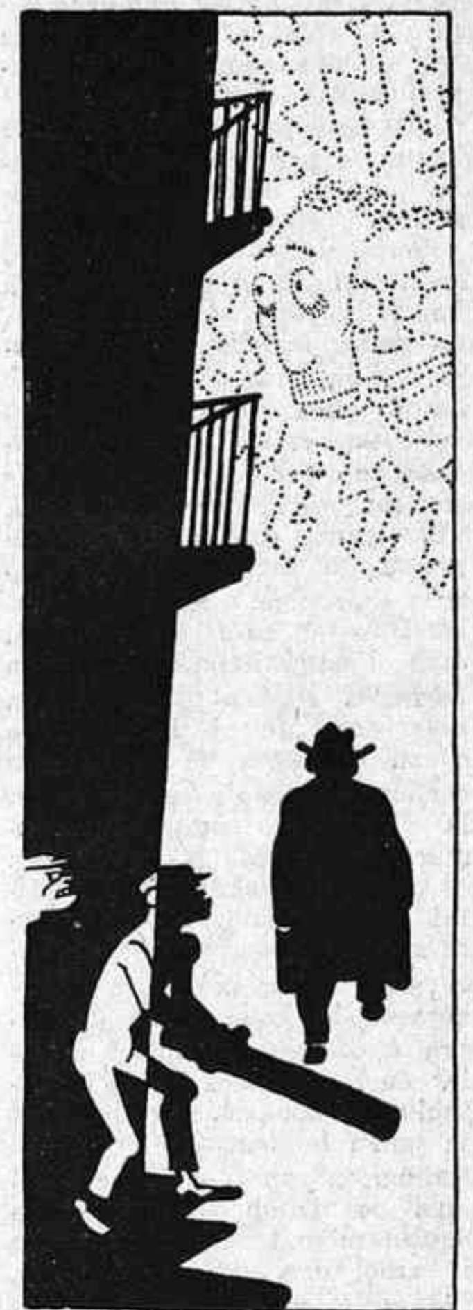
La justícia dels déus de l'Olimpo... de Oro

lunya com un afer de religió, i la meua religiositat afaïona el meu catalanisme a tall de liberalisme a ultrança; cada cop que la bandera de Catalunya oneja, victoriosa, amb la quàdruple corrua de les seves barres, jo sento com si una espurna del sentiment païral em resseguís les entranyes; ja que lluitar, doncs, contra de tants